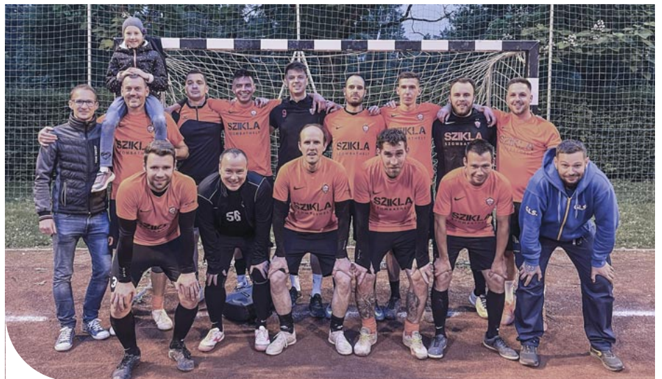
A II. osztályt megnyerő Szikla M.F.C.