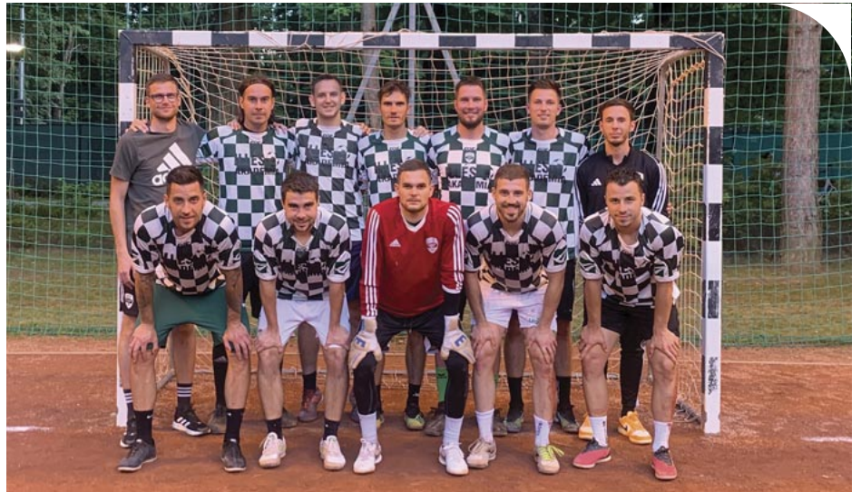
Az Illés Akadémia Fiatlok csapata