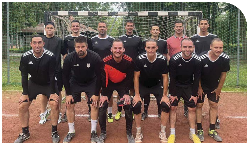
A III. osztály győztese a DH Smart Home Generál Kft.