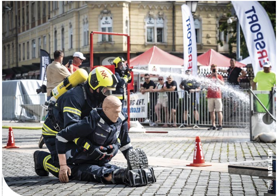
☉ A legerősebb tűzoltók versenyét rendezték Szombathelyen

A TFA (Toughest Firefighter Alive) indulóinak – az elmúlt évektől eltérően – idén egyetlen versenypályára kellett összpontosítaniuk, az úgynevezett Firefighter Combat Challenge feladatokkal kellett megküzdeniük. Ezek hasonlítottak azokhoz, amelyekkel a munkájuk során nap mint nap találkozhatnak. A próbatételek között szerepelt tizenkét méter magas állványra feljutás, gerendadarab kalapálása, úgynevezett „C” sugárral célba lövés, majd, már erejük fogytán egy nyolcvan kilogrammos bábut is be kellett húzniuk a célba. A versenyt idén is gazdag kísérőprogramokkal tették színesebbé a szervezők. Szakmai bemutatókkal, családi és gyermekprogramokkal várták a látogatókat.