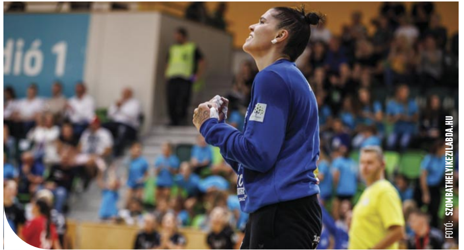
FOTÓ: SZOMBATHELYI KEZILABDA, HU

© De Almeida parádésan védett a Kisvárdá ellen