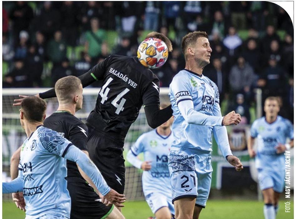
☉ A fejetlenség után rendeződhet a Haladás helyzete

A későbbiekben az önkormányzat a szurkolók által létrehozott egyesületre 1%-os névértékű üzletrészt ruházna át. A Szombathelyi Haladás Vasutas Sportegyesület a lehető legrövidebb időn belül át kívánja ruházni az indulási jogot, ezért a végleges tulajdonosi struktúra és a társaság üzleti tervének kidolgozása előtt már most indokolt létrehozni a társaságot.