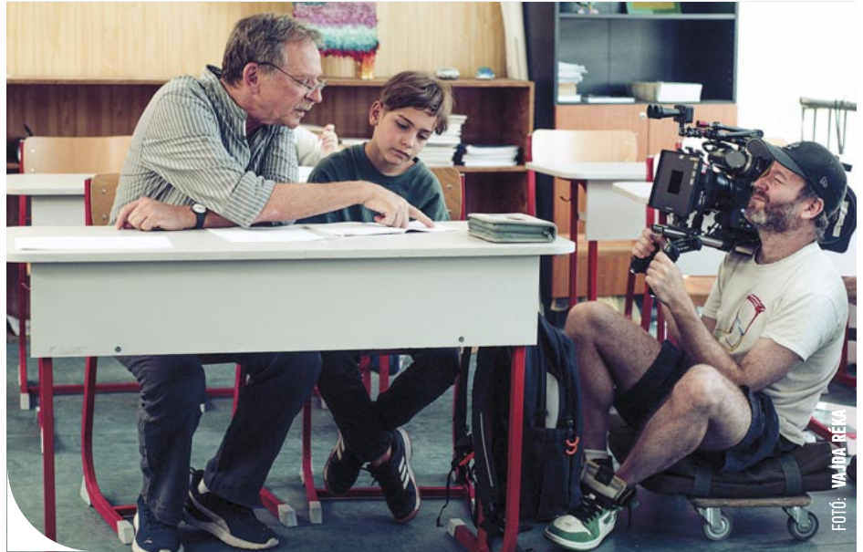
FOTÓ: VALDIA REKA

© Forgatási pillanat: készül a Fekete pont