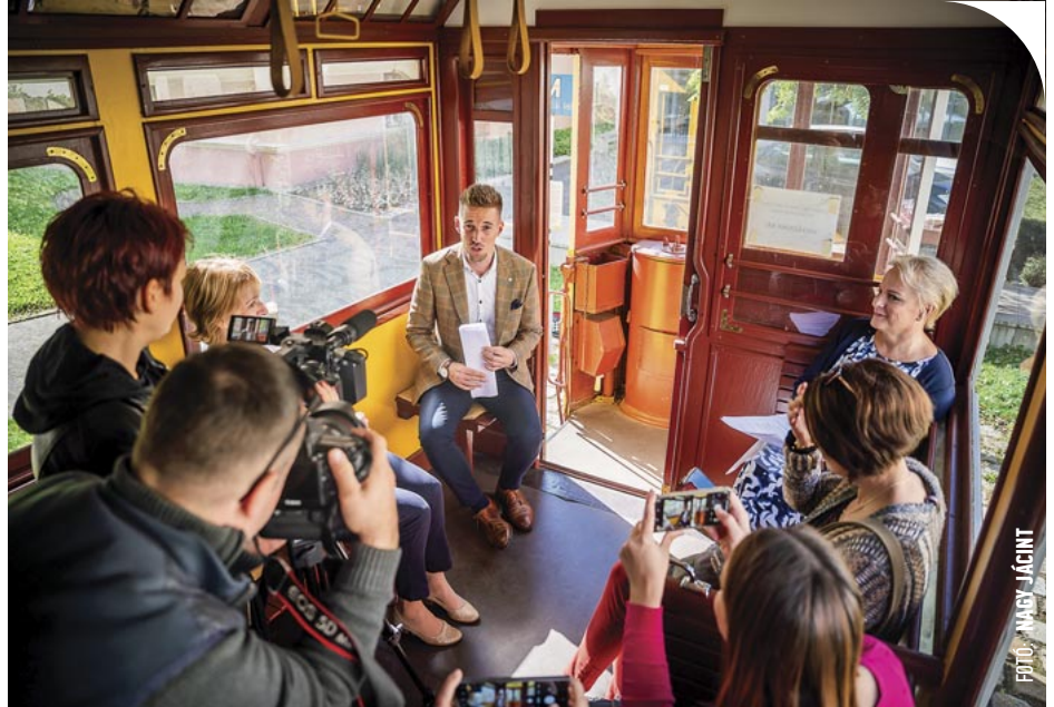
© Sajtótájékoztató a villamoson: programok őszi és téli