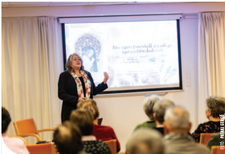
© Dr. Sirató Ildikó színháztörténész a Berzsényi Dániel Könyvtárban

Végigélte, túlélte a világháború, Trianon veszteségeit – no meg életvéneinek gyarapodását: példaként szolgálva arra, hogy az identitás a legnehezebb körülmények között is őrizhető. Ez azonban a legkisebb hanyagságot sem tűri, a színpadon, a magánéletben és a nyilvánosság terepén sem – s bár Márkus idejében kap