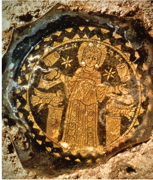
Fig. 17: Gold glass with St. Agnes, two doves, and two stars, ca. 350-400 CE. Cimitero di Panfilo (in situ), Rome.

also in January, listed in the Hieronymian Martyrology (5/6th c.) 29 and she represents the quintessential martyr cult in Rome. 30