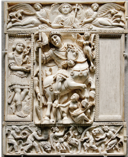
Fig. 25: Leaf of an ivory diptych with the emperor in triumph (Justinian?), so-called Barberini Diptych, 6 th century, Musée du Louvre, Paris.

These secular diptychs are also called consular diptychs; they were intended as luxury gifts by consuls at the inception of their position as a reward to people who supported their candidacy. A law of 384 decreed that only consuls could manufacture and distribute precious diptychs made from ivory or gold. 59 These consular diptychs then were taken over for ecclesiastical or liturgical purposes. Some may also have been given to influential bishops at the time, but there is no record to prove this. 60 Of the sixty-eight ivory consular diptychs in-