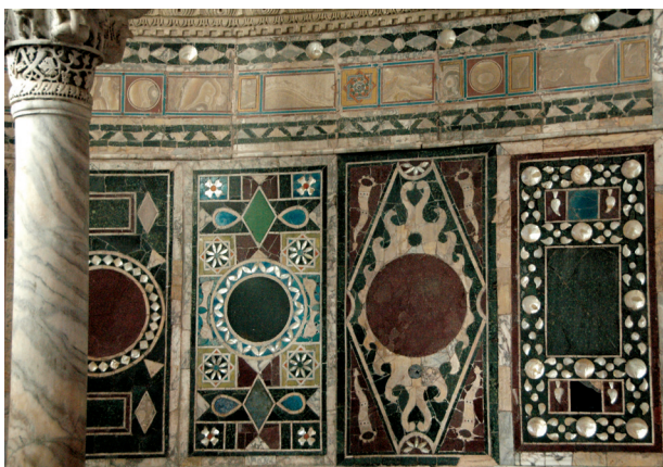
Fig. 11: Proconnesian marble column and lower part of the apse with multi-colored inlays. Euphrasian Basilica, Poreč

Few other places have such a striking array of female saints (fig. 12).