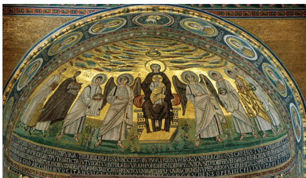
Fig. 7: Apse mosaic with the Virgin Mary and the Christ child in the center flanked by angels, saints, and ecclesiastical officials. Euphrasian Basilica, Poreč