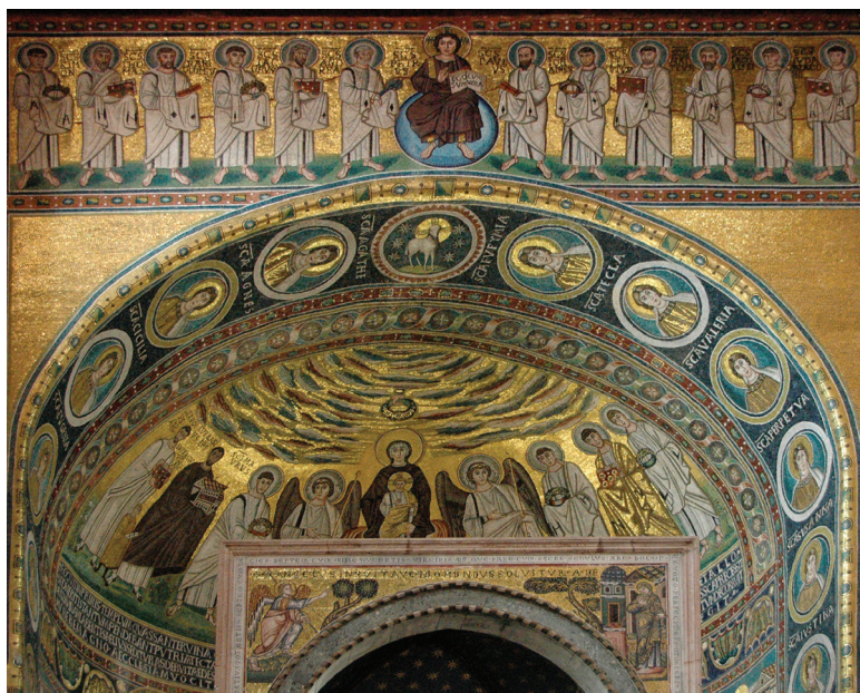
Fig. 1: Apse mosaics of the Euphrasian Basilica, Poreč

The church, which dates to the second quarter of the sixth century (539-550), was built under the auspices of a local bishop by the name of Euphrasius; he is depicted in the apse mosaic of the church, which was rebuilt on older foundations, possibly on a site connected with the veneration of martyrs (fig. 2). 10