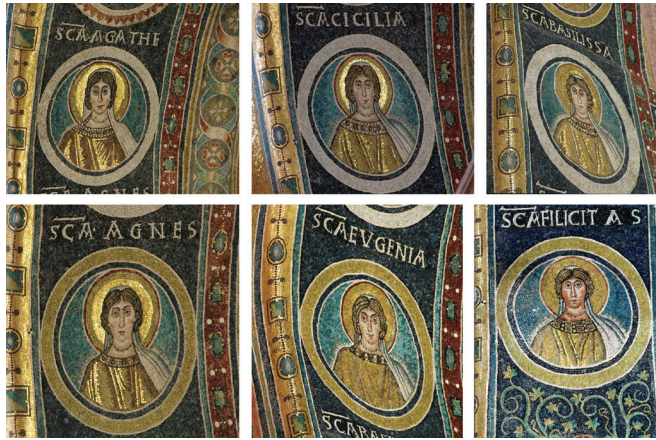
Fig. 13: Mosaic roundels of female saints depicted on the underside of the triumphal arch. Apse mosaic of the Euphrasian Basilica, Poreč

and to the right: EVFYMIA, TECLA, VALERIA, PERPETVA, SUSANA, IVSTINA.