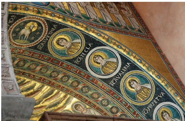
Fig. 12: Underside (soffit) of the triumphal arch with portraits of female saints. Apse mosaic of the Euphrasian Basilica, Poreč

Few other places have such a striking array of female saints (fig. 12).