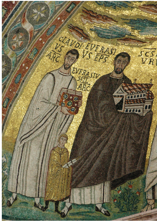
Fig. 2: Bishop Euphrasius, Archdeacon Claudius, and his son Euphrasius. Apse mosaic of the Euphrasian Basilica, Poreč

The building is a three-aisled basilica with relatively long rows of columns, as is common across the Adriatic in early Christian Italy. The columns and other marblework, however, are largely imported from Constantinople or the nearby Proconnesian quarries. This combination of works of local construction and imported decoration marks the churches built in this area after the Byzantine reconquest, as Richard Krautheimer characterized it. 11 Two shallow side apses, which are also Eastern features, flank the central large apse (fig. 3).