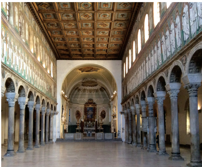
Fig. 21: Basilica of S. Apollinare Nuovo, Ravenna: nave with mosaic processions of martyrs above the arcades

In the church of S. Apollinare Nuovo in Ravenna, which like Parenthum had its mosaics applied around 550, all six female saints of the bishop's chapel reappear. No longer, however, are they portrait busts in roundels but rather full-length figures covering the north wall of the nave immediately above the supporting arches (fig. 21).