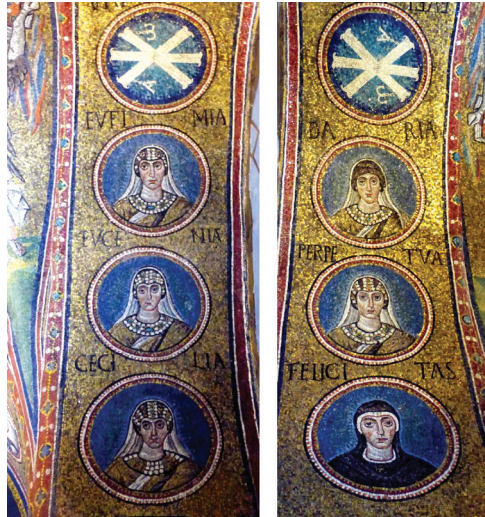
Fig. 20: Archbishop's Chapel, Ravenna, north arch with female martyrs

Sebastianus, Fabianus, and Damianus. On the north are the now familiar Saints Euphemia, Eugenia, Caecilia, Daria, 48 Perpetua, and Felicitas - only Daria being unparalleled so far; they all are conveniently labeled (fig. 20).