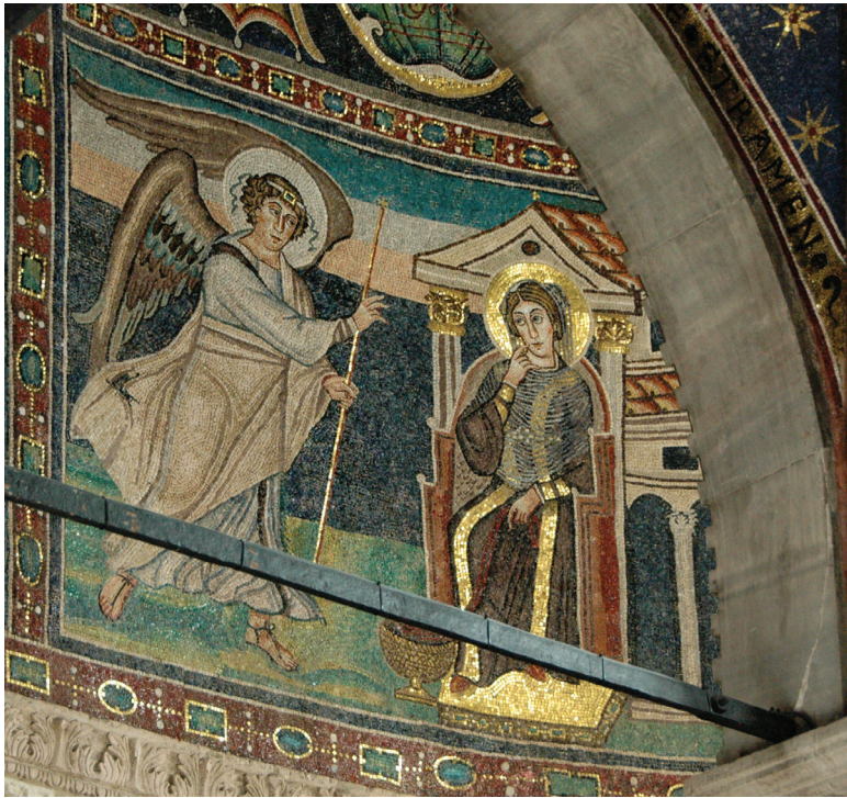
Fig. 8: Lower apse wall with mosaic of the Annunciation. Euphrasian Basilica, Poreč

filthy, and then devoid of great mosaic decoration; the rotted roof hung only by the power of grace. Immediately when Eufrasius, provident bishop and fervent in the zeal of faith, saw that the church was about to fall under its own weight, he forestalled the ruin with saintly inspiration; he demolished the ruinous temple in order to set it more firmly. he built the foundations and erected the roof of the temple, finishing what you now see, shining with the new and varied mosaic (glittering in a variety of gold: AvdH). Completing his undertaking, he decorated it with great munificence and naming the church he consecrated it in the name of Christ. Thus joyful from his work, a happy man, he fulfilled his vow.” Translation: Terry and Maguire, Dynamic Splendor , vol. I, 4-5; for the Latin text, see also Degrassi, Inscriptiones Italiae , 37-40, no. 81.