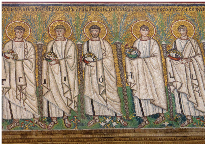
Fig. 23: Male martyrs, S. Apollinare Nuovo, Ravenna

The numbers of saints have greatly increased in S. Apollinare Nuovo compared to the episcopal chapel or Poreč; the majestic procession of female martyrs counts 22. The male saints on the south side of the nave even surpass that number: 25 are shown proceeding forward with crowns in hand (fig. 23).