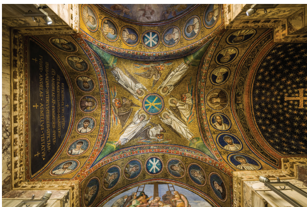
Fig. 19: Archbishop's Chapel, Ravenna. Vault mosaic with busts of apostles and martyrs.

The chapel was built around the year 500 in the form of a Greek cross with an apse on the eastern side and a rectangular vestibule on the western. 45 Although many restorations have taken place, the mosaics covering the vault and the soffits of the four arches seem to have remained largely intact. 46 The soffits on the eastern and western sides show the twelve apostles in groups of six; the most important ones such as Peter and Paul flank Christ on the eastern side toward the apse along with James, John, Andrew and Philip, while the other six apostles flank Christ on the western side. The north and south sides show the portrait roundels of six female and six male saints. On the south are the male Saints Cassianus, Chrysogonus, Chrysanthus, 47