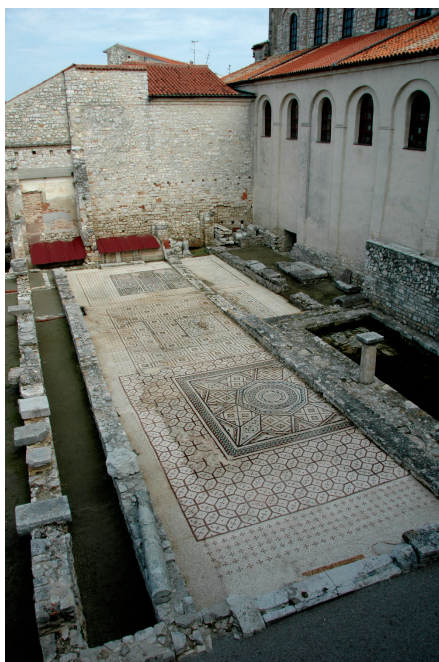
Fig. 5: Excavated remains of the 4th and 5th century cathedrals in Poreč

The facade of the church was decorated with mosaics, which have now mostly disappeared. Opposite the church is a 5 th century baptistery, and a medieval tower is built over it. From above one has great views over the old city and the bay. It is tempting to discuss more interesting aspects of this complex, but we now return to the main subject: the mosaics in the church itself with its female martyr portraits.