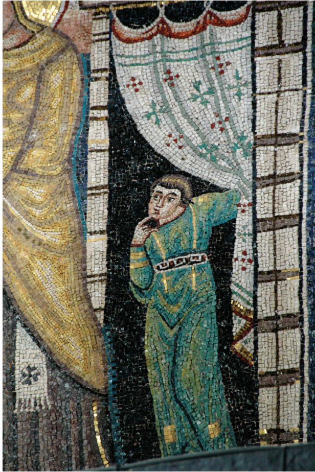
Fig. 10: Detail of the mosaic of the Visitation: figure peeking out of the doorway. Euphrasian Basilica, Poreč

Other panels in the lower part show Zacharias, an angel with a globe, and John the Baptist. They are also without names, but their attributes define them. The lower part of the apse has liturgical furniture: a bench for the clergy and a throne for the bishop. It is embellished with gray-banded Proconnesian marble and multi-colored inlays; the mother-of-pearl makes the design sparkle (fig. 11).