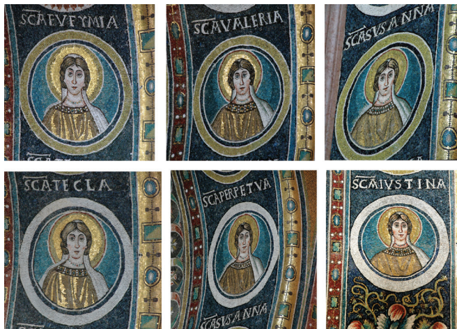
Fig. 14: Mosaic roundels of female saints depicted on the underside of the triumphal arch. Apse mosaic of the Euphrasian Basilica, Poreč

and to the right: EVFYMIA, TECLA, VALERIA, PERPETVA, SUSANA, IVSTINA.