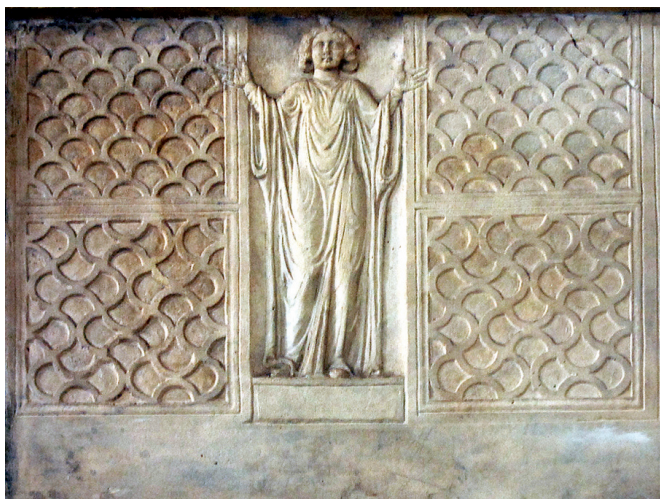
Fig. 15 and Fig. 16: Damasus, Epigram 37, Elogium S. Agnetis. Church of S. Agnes Outside the Walls, Rome, access ramp to narthex; Marble relief with S. Agnes as orans between lattice work as part of an altar or shrine (?), 4 th century, Church of S. Agnes Outside the Walls, Rome, access ramp to narthex

The latter could have been part of an altar or a shrine. 27 Agnes also appears frequently on gold glass vessels found in fragmentary state in the catacombs - one is still in situ (fig. 17). 28 She had a second feast day