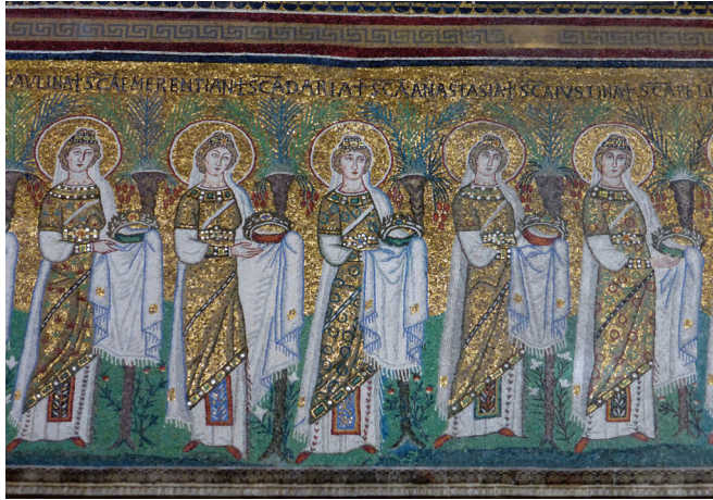
Fig. 22: Female martyrs, S. Apollinare Nuovo, Ravenna

The numbers of saints have greatly increased in S. Apollinare Nuovo compared to the episcopal chapel or Poreč; the majestic procession of female martyrs counts 22. The male saints on the south side of the nave even surpass that number: 25 are shown proceeding forward with crowns in hand (fig. 23).