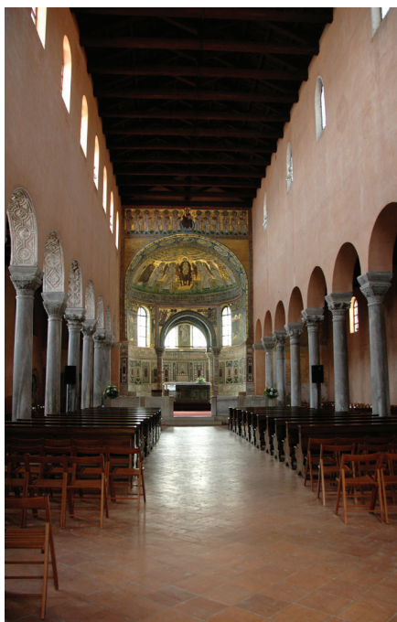
Fig. 3: Interior of the Euphrasian Basilica, Poreč: a three-aisled basilica with columns

Its glittering mosaics were heavily restored in the late 19th century, as can be seen upon close inspection. The overall effect, however, is still grand and impressive. 12 Since 1997 the whole complex has been included in the UNESCO list of World Heritage sites – and for good reason. The Euphrasian Basilica is the most integrally preserved early Christian cathedral complex in the region (fig. 4). 13