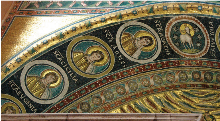
Fig. 6: Underside (soffit) of the triumphal arch with portraits of female saints. Euphrasian Basilica, Poreč

seated on a blue sphere in the center. He is holding an open book with the inscription: EGO SVM LVX VERA. On the underside (soffit) of the triumphal arch appear the twelve female portraits in large roundels centered on a medallion of the Agnus Dei (fig. 6).