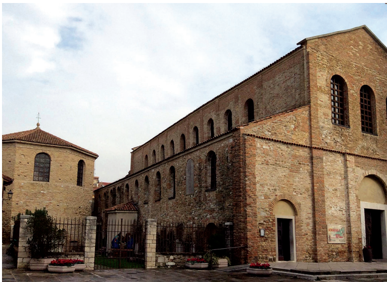
Fig. 18: Grado, Church of S. Euphemia (6th century) and baptistery

In the controversy known as the Three Chapters Schism, the bishops of Aquileia, Milan, and the Istrian peninsula had refused to condemn the so-called Three Chapters. Those were texts written by three 5th c. bishops of the East, Theodore of Mopsuestia, Ibas of Edessa, and Theodoret of Cyrhus, who were suspected of Nestorian sympathies. This conflict, which led to the 5th oecumenical Council in Constantinople in 553, was for a large part driven by the imperial politics of Justinian, who saw an opportunity to reconcile the Monophysites with Constantinople. 42 The north Italian and Illyrian bishops may not have been much interested in the intricate