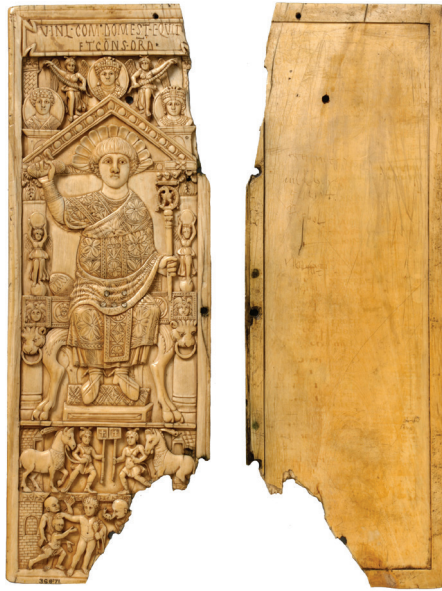
Fig. 26: Leaf of a diptych of the Consul Anastasius, 517 CE, ivory, Victoria & Albert Museum, London.

Putting the saintly names into the database with the mosaics it becomes possible to see interconnections between early Western liturgical traditions and the mosaics of Ravenna and Parentium. First the correspondences and variations of the liturgical traditions themselves should be examined. In the liturgy, most male saints occur in the first intercession of the “Communicantes”; they are placed after the twelve apostles. 66 The female saints, however, occur in the second intercession of the “Nobis quoque,” accompanied by a few other male saints or protomartyrs. It is worth noting that in the sacramentary of