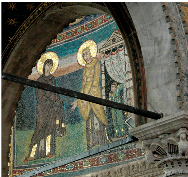
Fig. 9: Lower apse wall with mosaic of the Visitation. Euphrasian Basilica, Poreč

Both women are visibly pregnant, which adds to the female prominence of the mosaics' program and design. 17 Behind the figure of Elizabeth is a delightful detail: a small female figure peeks out behind the curtain with a puzzled expression (fig. 10).