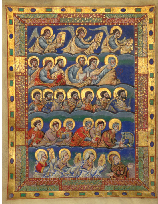
Fig. 24: Page of the so-called Sacramentary of Charles the Bold, 869-870, Bibliothèque nationale de France, ms. Latin 1141.

My main sources were (early medieval sacramentaries and missals (fig. 24).