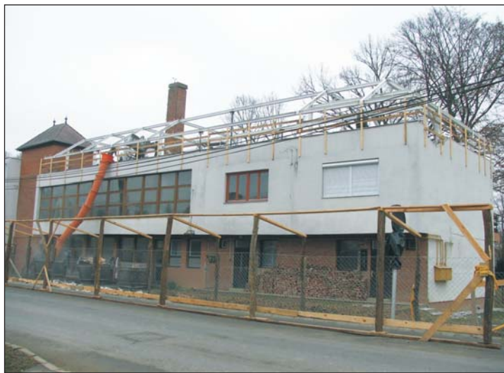
Dolgoznak a letenyei Egészség ház tetején.

Letenye Város Önkormányzata még tavaly augusztus 2-án támogatási szerződést kötött a „Letenye városban egészség ház kialakítása” című