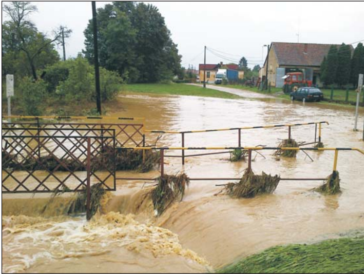
Villámárvíz a Béci patakban Letenyén a 7-es főút mellett a tűzoltóság épületénél.

A kormány.hu portálon megjelent információk szerint Letenye Város a 2014. december 22-i belügyminiszteri döntés eredményeképpen 67.218.000 Ft vis maior támo-