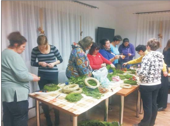
A falu apraja-nagyja serénykedett.