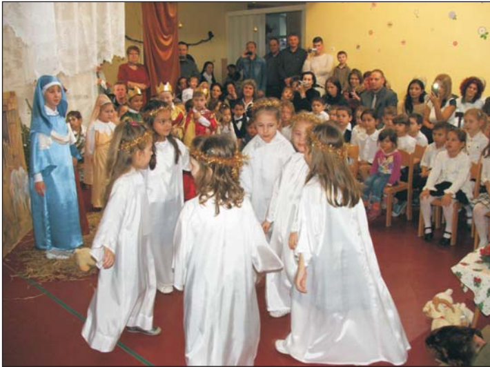
Emlékezetes műsort adtak.