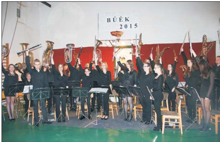
Az újévi koncerten a fúvószenekar.

A letenyei Derű Zeneegyesület szervezésében és Letenye Város Önkormányzata támogatásával idén (január 3-án) első alkalommal került megrendezésre Letenye Város Fúvószenekara újévi koncertje az Andrássy Gyula Általános Iskola tornatermében.