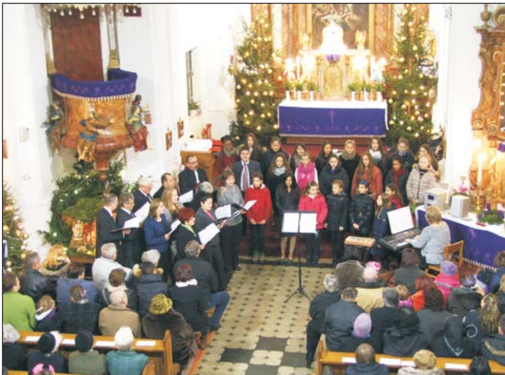
Vastaps jutalmazta a fellépőket.