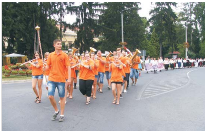
A horvát folklór est és a bornapok résztvevőit Letenye Város Fúvószenekara vezette fel.