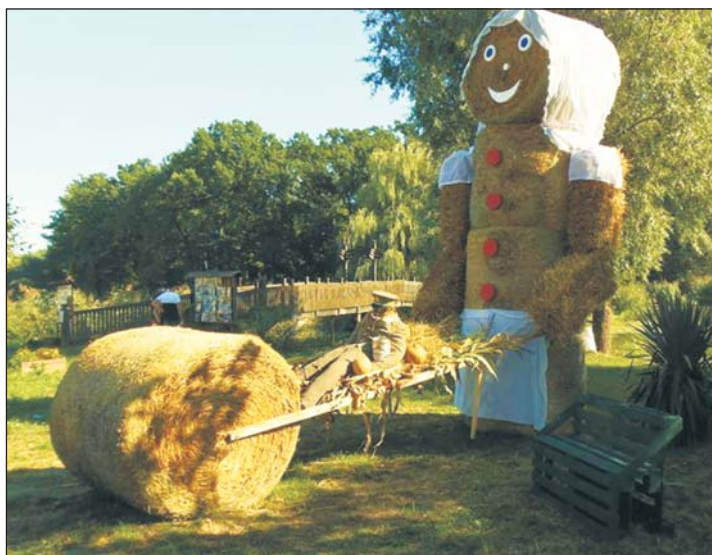
Nagyasszony a katonával.