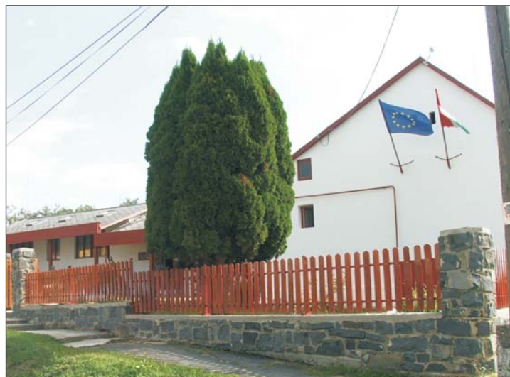
Megújult környezetben tanulhatnak a diákok.