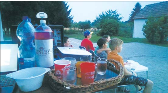
A legjobb a szabadtéri mozizás volt.

Már egy hónapja tart, hogy minden hét csütörtök este a falu fiatal lakói együtt moziknak a Molnári IKSZT-ben. Minden hét elején megy az ötletelés, hogy milyen filmmel vagy esetleg mesével készülünk. A mozizás hangulatát fokozza a pattogatott kukorica illata, és persze mellé az elmaradhatatlan szörp. Pár lelkes fiatal minden alkalommal segít az előkészületekben, együtt rendezzük be a „mozitermünket”