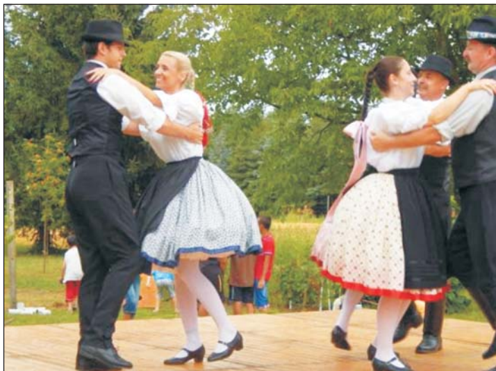
Néptánc is szórakoztatta a közönséget.

A szervezők és segítők mind hozzájárultak ahhoz, hogy a több száz ember egy feledhetetlen napot tölthessen el felszabadultan, színvonalas produkciókat látva Muraszemenyén.