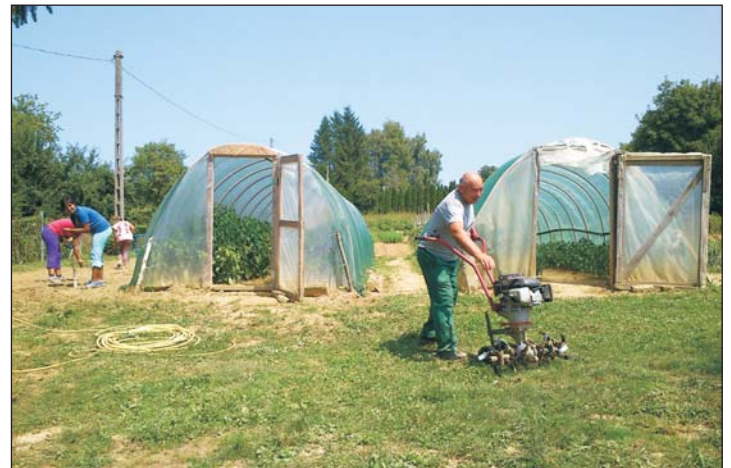
11 embernek ad napi munkát, megélhetést.