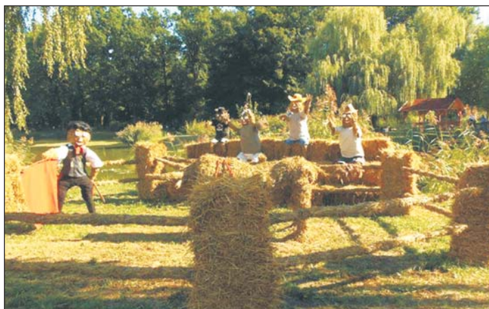
A győztes helyi csapat alkotása a Bikaviadal.