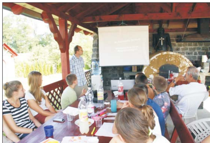
Az utánpótlás nevelése, a csillagászat szeretetének terjesztése volt a cél.

A programok közé természet tudományos ismeretbővítést is becsempészték,