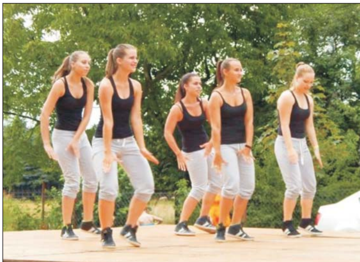
A modern tánc sem hiányzott a programból.