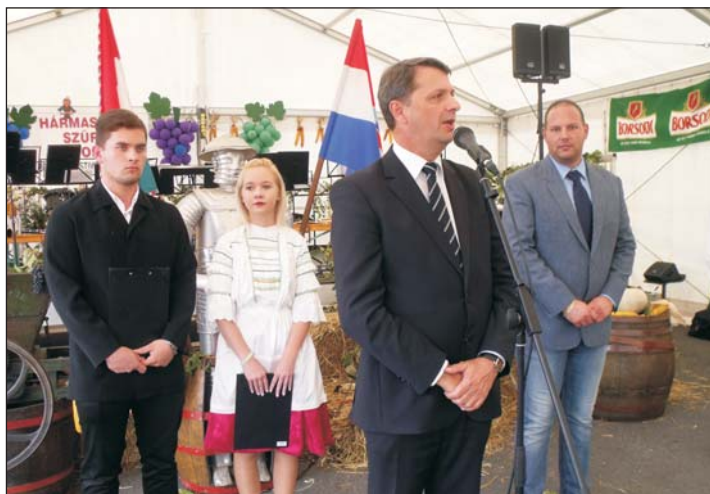
Cseresnyés Péter köszöntője.

gyon jó példát ad arra, hogy azok, akik szeretve szülőföldjüket, közösségüket visszatérve a szenvedésből mennyi mindent hajlandók megtenni az országért. Bár látszólag nem ide tartozik az október 2-i népszavazás, de erről is szól a történet. A háborús, gulágos veszteségek ellenére a nemzet mindig talpra állt, minden bajból kilábal és most újra egy próbatétel előtt áll. Ez pedig nagyobb horderejű, mint a korábbiak, mert most a bevándorlással egy nagyobb veszély fenyeget – mondta az államtitkár, aki egy közismert, bár nem túl kedvelt tévéműsor címevel példázta a kialakult helyzetet, ami így szól, most a lét a tét. A letenyei kiállítás a könyvtár nyitvatartási idejében szeptember 27-ig volt látható.