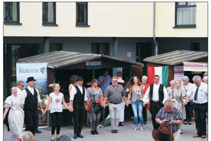
Kitűnő hangulatot teremtettek a dél-zalaiak a vendéglátó helyiek körében.