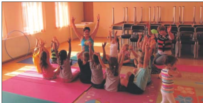
Gyermekjoga az óvodásoknak.