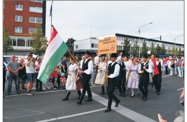
A kanizsai táncosok a menet élén.