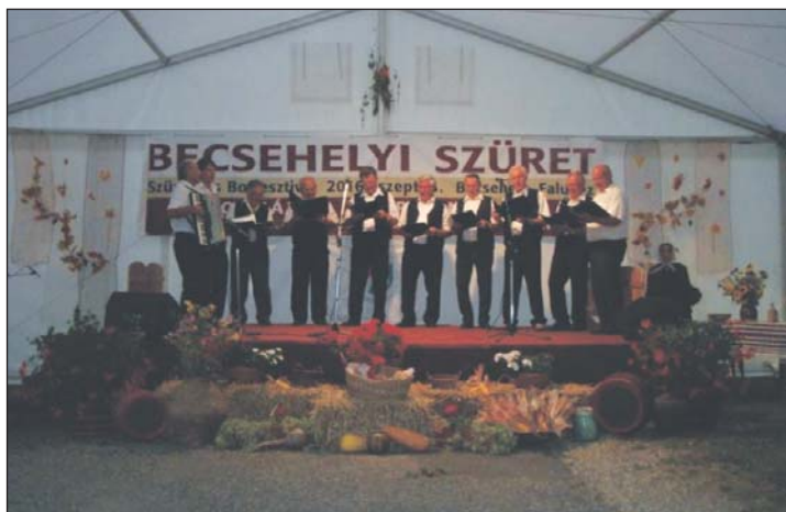
A Becsehelyi Dalárda fellépése.

Verőfényes napsütés, vidám emberek, bor, pálinka, must, szőlő, pogácsa, zeneszó, táncosok és jókedv - röviden összefoglalva ez jellemezte a szeptember 6-án, vasárnap megrendezett XII. Becsehelyi Szüreti- és Borfesztivált.