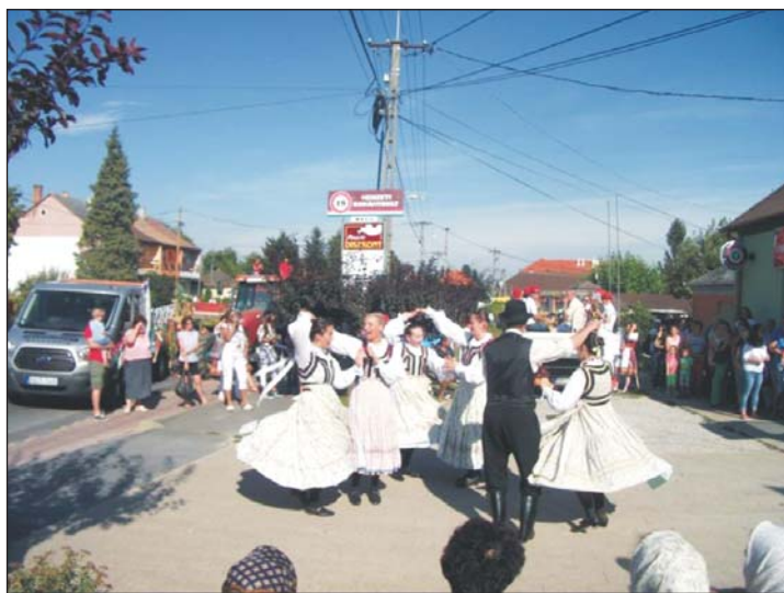
A Zalagyöngye Táncegyüttes műsora.