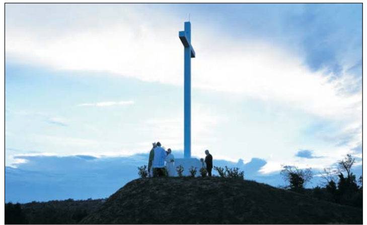
A fénykereszt áldása.