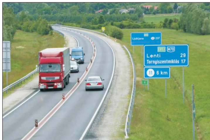
Az M70-es autótút Letenyénél.