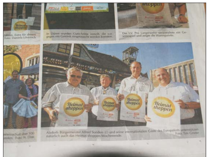
A helyi sajtó részletesen beszámolt a látogatásról.