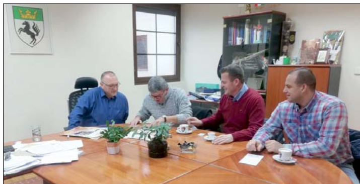
Tárgyalás Donji Kraljevecben.

– Az a jó, ha merünk nagyot álmodni. Mert legalább van cél a szemünk előtt, amihez tartathatjuk magunkat. Ha vannak terveink, vágyaink, ötletünk és programunk, könnyebb azokat megvalósítani is. Amikor például újraindítottuk a focicsapatunkat, senki nem gondolta volna, hogy néhány éven belül a megyei II. osztályába is sikerül felkapaszkodnunk. Lépésről lépésre, de így fogunk haladni a programunk megvalósításával is. Elindítottuk az óvoda és iskolajáratot, hamarosan új autót szerzünk be az áruszállításhoz is, (Folytatás a II. oldalon)