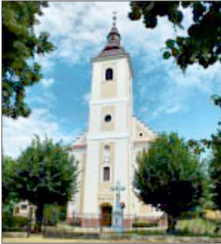
A templom méltó éke a településnek.

A következők sorokban Rigyác mutatkozik be. Nagykánizsától nem messze, 12 kilométerre, nyugatra található zsáktelepülés. Dimbes-dombos táj szőlővel, érintetlen hegyi ösvények, mesés-buja erdők, többek között így lehet bemutatni Rigyácot... Egy-egy szö-