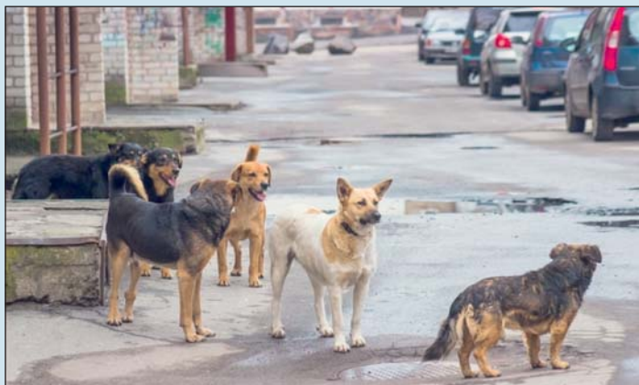
Sok gondot okoznak a szerencsétlen sorsú kóbor háziállatok.