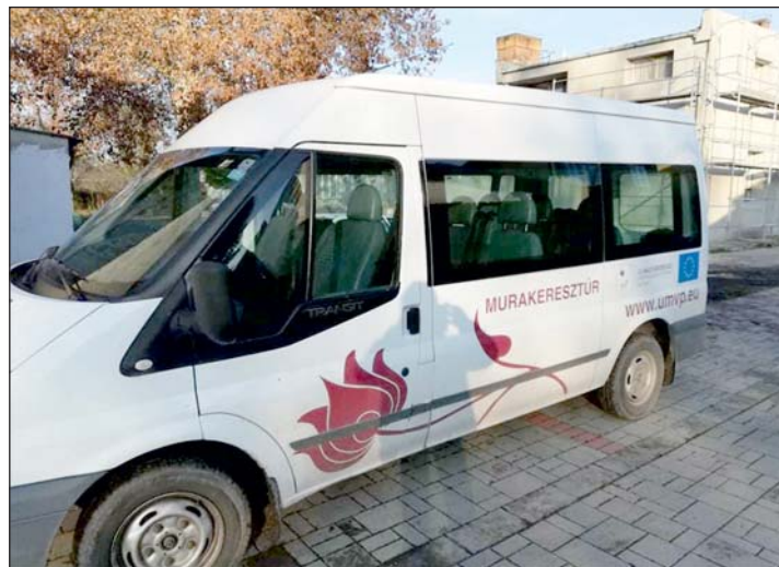
Időszakos buszjárat viszi a gyermekeket.

Újtelepről pedig \frac{3}{4} 8-tól viszik be azokat a gyermekeket, akiket a szülők nem tudnak elkísérni, elvinni az óvodába, vagy épp az iskolába. A buszokhoz a falu lakói ajánlották fel az ülésmagasítókat, hogy a KRESZ-szabályoknak megfelelően utazhassanak a gyerekek.