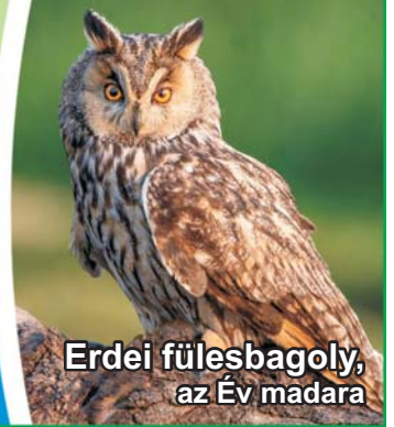
Erdei fülesbagoly, az Év madara