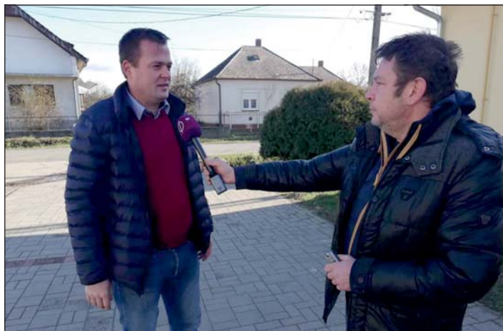
A polgármester nyilatkozik a televízió munkatársának.

Január 5-én, negyed 3-kor földrengés rázta meg Keresztúrt , de szerencsére személyi sérülés nem történt és anyagi kár sem keletkezett. Az ijedség azonban nagy volt. A polgármester a katasztrófavédelem-