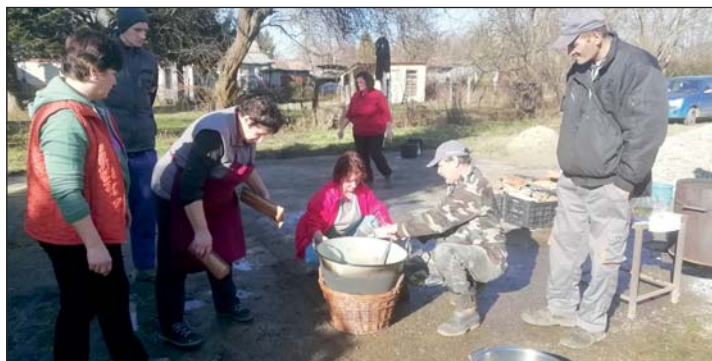
A tepertő kiprészelése.

ben, hurka, kolbász töltésében, töpörtyű sütésben.