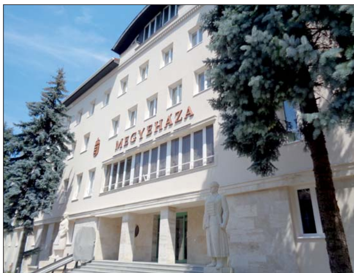
Számos kérdésben született döntés a Zala Megyei Közgyűlés ülésén.

Jóváhagyta a testület a magyar-magyar kapcsolatok ápolását és fejlesztését célzó együttműködések támogatását szolgáló Bethlen Gábor Alaphoz benyújtott „Gyarapodjunk együtt - határtalanul” című pályázat benyújtását, melyben a megyei önkormányzat partnere Kovászna Megye Tanácsa lesz. A program célja, hogy a két szervezet együttműködést alakítson ki a helyi induló fiatal vállalkozások támogatására, elősegítve ezzel a magyarság szülőföldön maradását és gazdasági fejlődését, mivel mindkét térségben problémát jelent a fiatalok elvándorlása. A pályázat megvalósítása során kiemelt figyelmet kapnának a fiatal vállalkozók, a start-up programok jó példái, az innovatív kutatási