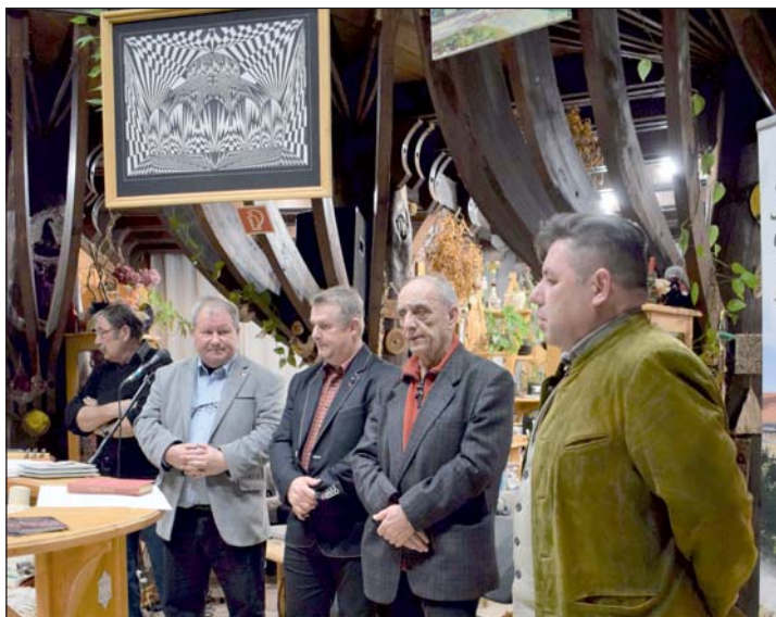
Az est főszereplői.