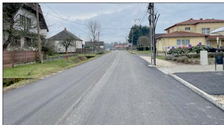
Új útburkolatot kapott a település egyik legforgalmasabb útja.

A fejlesztésnek immár hivatalosan is a végére értek. Már csak az új, szilárd burkolatú járdát kell kiépíteni, ehhez a nyomvonalat már most kialakították, még idén pályázni fognak rá, hogy ez is megvalósulhasson.