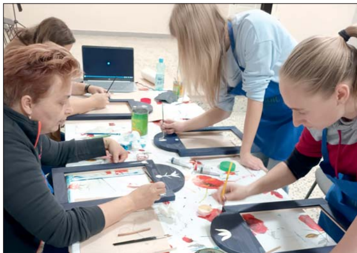
A képen a Faddi tükör elkészítése közben látható a csoport.

ber hónapban tudták azt továbbadni. A fényforrások személyes átvételére a Letenyei Család- és Gyermejközpontot jelölték ki. Idén januárban a tavalyi érdeklődésre tekintettel a CYEB Kft. jóvoltából meghirdették a program második fordulóját azon letenyei háztartások számára, akik az első lehetőséget nem vették igénybe, vagy kimaradtak a regisztrációból. A programhoz csatlakozási feltételek változatlanok maradtak, a regisztrációra február 15-éig volt lehetősége a lakosságnak, melyben segítséget az önkormányzat családsegítő központjának munkatársa nyújtott – tette hozzá a polgármester.