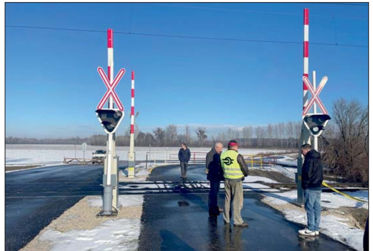
Biztonságos, védett útvonalon tekerhetnek majd a Mura-mentén.

A Zala Vármegyei Közlekedési Hatóság és a kerékpárút használatbavételi eljárásban érintett hatóságok helyszíni szemlét tartottak Murakeresztúron , hogy az új Mura-menti kerékpárút és a hozzá kapcsolódó új vasúti átkelő is megkaphassa a hivatalos birtokba vételi engedélyt. Az új bicikliút Keresztúr és régió egyik legfontosabb turisztikai attrakciója