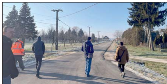
Felmérik az Arany János felújításra váró szakaszát.

téssel helyreállíthatják az útszakaszt. Az önkormányzat addig is arra kér mindenkit, hogy óvatosan közlekedjenek itt.