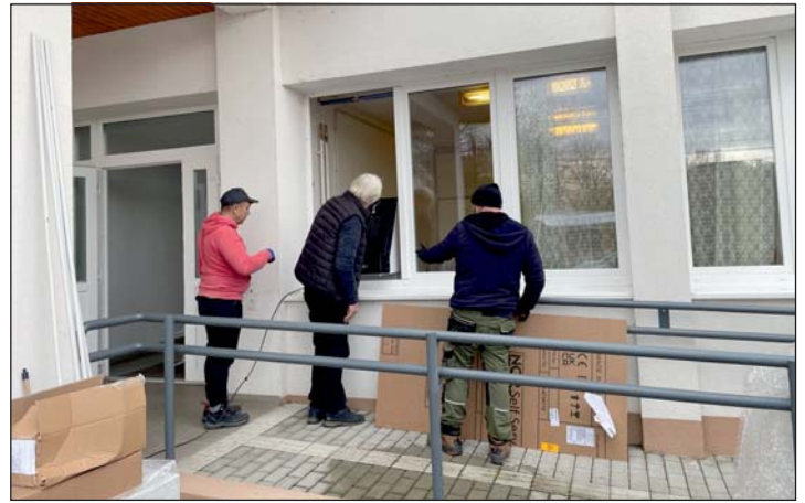
Az új bankautomatát a megújult önkormányzati épület oldalába szerelték fel.

Murakeresztúri Óvoda - Pénzforgalmi fizetési számla: 50431104-10035199