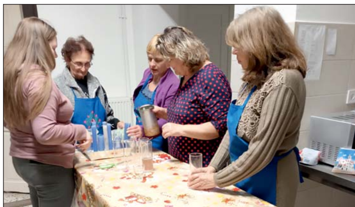
A gyertyaöntés eszközeit készítik elő a tagok.