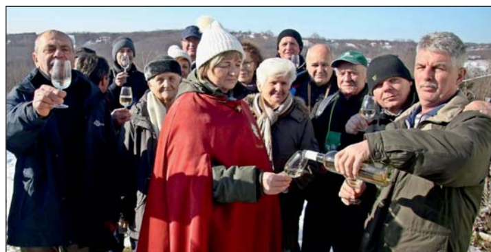
Több évtizedes hagyomány Letenyén.

– A Vince-napi szőlővessző szentelés és a hozzá kapcsolódó pincejárás nálunk legalább