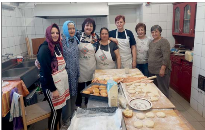
A fánksütő csapat.

A visszajelzések alapján nagyon örültek a finomságnak, ezért tervezik a kezdeményezés folytatását.