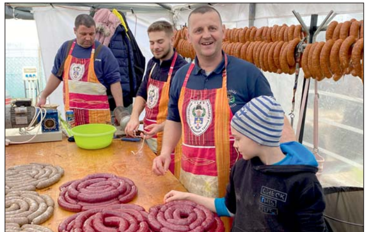
A Keresztúri Szikracsapók immár tizedszer vettek részt a Murakeresztúri Böllérfesztiválon.