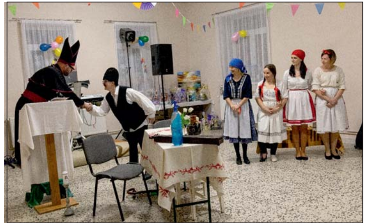
Gazdag volt a kulturális műsor.

Zárásként az igazgató megköszönte a rengeteg támogatást, a tombola-felajánlásokat, a belépőjegyek és pártolójegyek megvásárlását. A szülői munkaközösség és kollégái aktív,