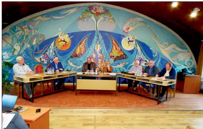
Az érdeklődés most csekély volt.

például az Eötvös utcai óvoda felé történő járda építésére, a Szent Imre herceg utca burkolatának, a közös önkormányzati hivatal épületének, a városi könyvtárnak, vagy az egyik ravatalozónak a felújítására, illetve egy traktor beszerzésére szóló igényüket – forráshiány miatt – elutasították. A polgármester úgy fogalmazott: ezek a pályázatok tartalmilag és formailag is megfeleltek a kiírásnak, vagyis nem az önkormányzat hibája, hogy nem tudták megvalósítani a tervezett programot. Nyert viszont a regionális kerékpárút fejlesztésére kiírt pályázat, amelynek lebonyolítója a vármegyei önkormányzat. Ezzel a beruházás-