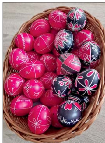
Horvát és magyar népi mintával díszített tojásokból lesz kézműves foglalkozással egybekötött kiállítás.