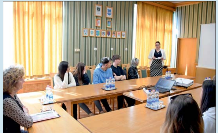
Az elhangzott tájékoztató kiemelte, hogy fontos az elméletben tanultak gyakorlati hasznosítása.

Dr. Sifter Rózsa köszöntőjében kitért arra, hogy a Zala Vármegyei Kormányhivatal kiemelten fontosnak tartja a fiatalok segítségét a számukra megfelelő pályaválasztási döntés meghozatalában, ezért az országban elsőként egy teljesen új pályaválasztási programot dolgoztak ki. A főispán ismertette a több mint tízéves múltra visszatekintő kormányhivatali rendszert, majd bemutatta a hallgatóknak a hivatal működését, akik végül kérdéseket tehettek fel a főispánnak.