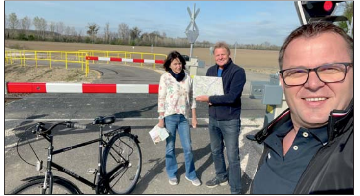
Fellendítheti a turizmust a Mura-menti bringaut.

menti bicikliúton. Nyáron egy nagyobb csoporttal térnek majd vissza, most a tervezett túraútvonalukat járták be. El voltak ragadtatva a tájtól, júliusban már két keréken térnek vissza társaikkal.