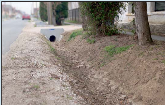
123 millió forint 100 %-os támogatást nyert el Vasboldogasszony.