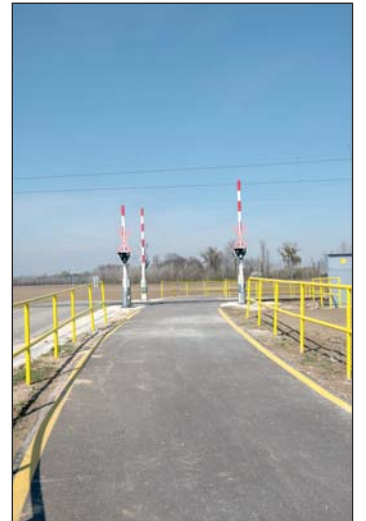
Modern, biztonságos vasúti átkelőt építettek a kerékpárútra.

A Molnári és Örtilos közötti bringaut jó lehetőséget nyújt arra, hogy minél többen megismerhessék a Mura kivételes természeti értékeit, fellendítsék a környék turizmusát.