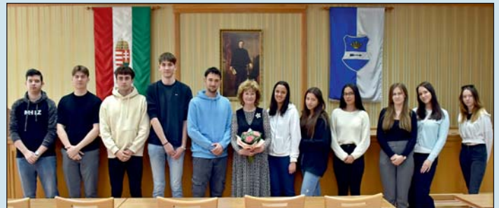
A kanizsai diákok a kormányhivatalban.