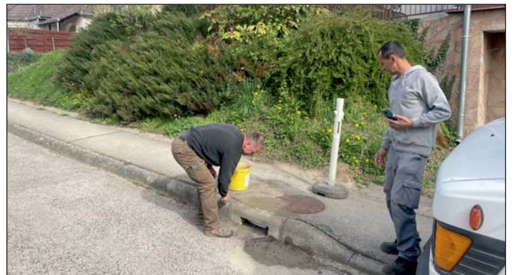
Murakeresztúron tavaszi karbantartási feladatokat végeznek az önkormányzat dolgozói.

Április elején a murakeresztúri önkormányzat karbantartói kijavították az Alkotmány út egyik csapadék-elvezető lefo-