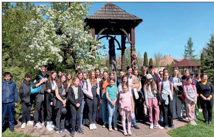
Keresztúri gyerekek Petőfi körtefájánál .

latot építhessenek településünk határain túl is, különösen tekintettel a határon túli magyarságra. Hiszen a magyar kultúra páratlanul gazdag, és rengeteg kincset rejt, ennek megismerése mindenkit gazdagabbá tesz. Székelykeresztúr ráadásul egy gyönyörű magyar város számtalan látnivalóval. Köszönjük a meghívást és a szíves vendégelátást. Júliusban mi leszünk a házigazdái a Keresztúr Nevű Települések nagy találkozájának. Tizenegy év után újra nálunk lesz a szövetség éves nagy gyűlése. Mi is sok-sok meglepetéssel, gazdag programkínálattal készülünk. A célunk az, hogy keresztúri barátaink megismerhessék vidékünk gyönyörű természeti kincseit és különleges horvát-magyar kultúráját.