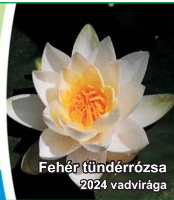
Fehér tündérrózsa 2024 vadvirága