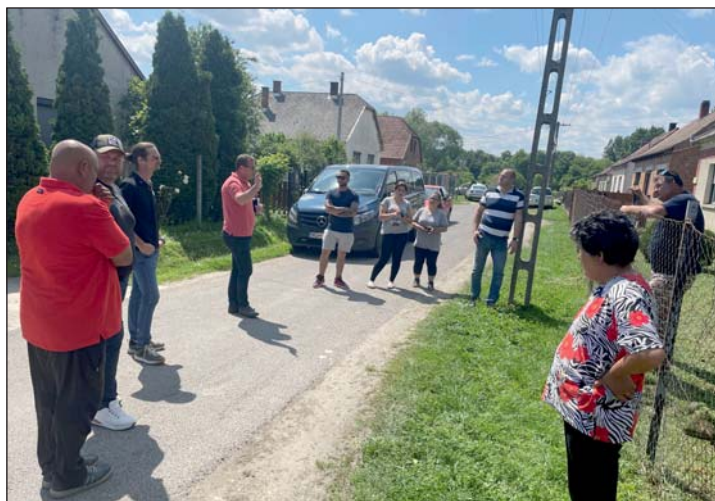
Fontos fejlesztéseket beszéltek át Újtelepen.