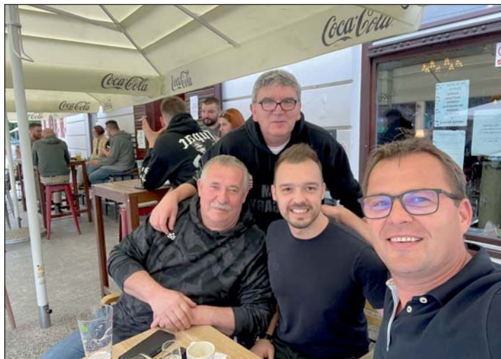
A Mejasi és a Csik Zenekar is fellép Murakeresztúron a nyáron.

A Keresztúr Nevű Települések Találkozáját július 11-től 14-ig tartják, több mint 700 vendég érkezik majd Murakeresztúrra Magyarországról és a határon túlról.