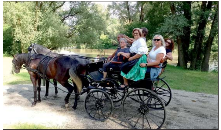
Lovaskocsikázás a Muráig.