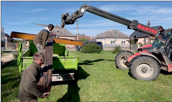
Megújult a Keresztúriak Keresztje.