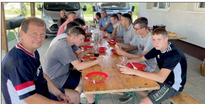
Közös ebéddel zárták a közösségi munkát.

Július 11-től 14-ig Murakeresztúr szervezte meg a Keresztúr Nevű Települések nagy találkozóját. A kereszt környékének rendezése, megújítása ezért is vált időszerűvé.