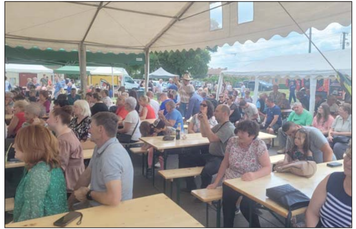
Sokan vettek részt a rendezvényen.

A rendezvény a Magyar Falu Program Falusi Civil Alap keretében „civil közösségi tevékenységek és feltételeinek támogatása” című alprogram keretén belül valósult meg, a Bethlen Gábor Alapkezelő Zrt. és Magyarország Kormánya támogatásával.