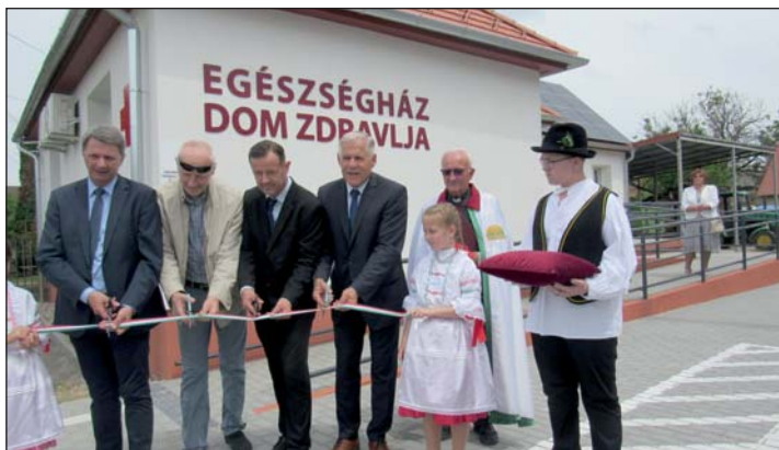
Az Egészségház avató ünnepsége.