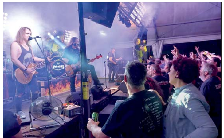
A Pokolgép koncertje.