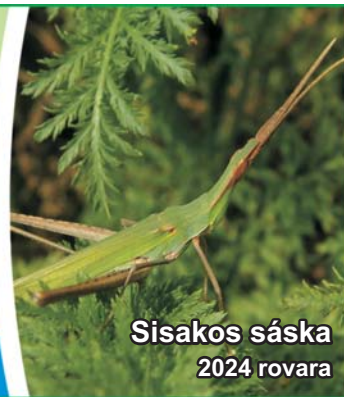
Sisakos sáska 2024 rovára