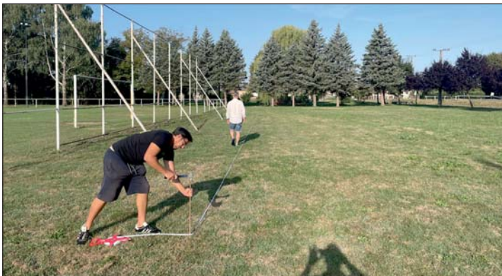
A nagy focipálya mögött építik meg az új műfüves pályát, a szakemberek már hozzá is kezdtek a beruházás előkészítéséhez.

A Murakeresztúri Sportegyesület 50 millió forintot nyert a pályára: külön világítással, palánkkal, labdafogó hálósával és körbe járdával építik meg, így minden adott lesz hozzá, hogy profi körülmények között játszassanak majd itt a keresztúriak.