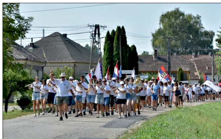
Több mint 800 keresztúri vonult végig Murakeresztúron a Keresztúriak.

Apátkeresztúr (Erdély 546 km), Bácskeresztúr (Vajdaság 305 km), Balatonkeresztúr (65 km), Bodrogkeresztúr (473 km), Csernakeresztúr (Erdély