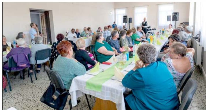
Sokan részt vettek a rendezvényen.