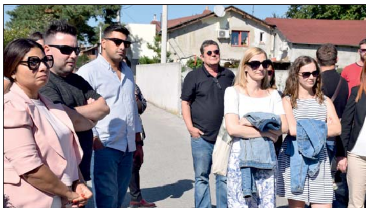
A pandémia miatt személyesen 2021. szeptember 8-án találkoztak a partnerek.

működő település életében az egyik legnagyobb mérföldkő a roma bölcsőde létrehozása volt. Az intézmény alapját képezi Pušča jövőbeni fejlődésének, ahol ma már a nem roma gyermekeket is fogadják, ezáltal az interkulturális együttélés szimbólumává is vált.