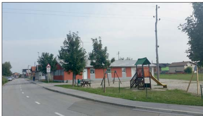
Számos jó példával találkoztak.

A Dream Road projekt 2022 decemberében fejeződik be magyarországi záró konferenciával, így még számos előremutató és innovatív tevékenység megvalósítása vár a partnerekre.