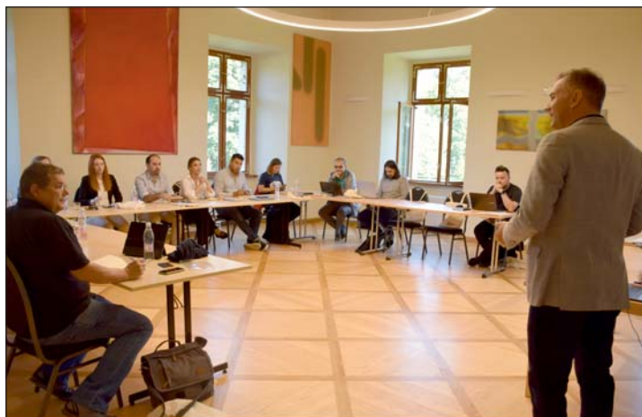
A partnertalálkozó színhelye a szlovéniai Rakičan volt.

Az INTERREG Duna Transznacionális Program által támogatott, uniós és hazai forrásokból megvalósuló DREAM ROAD projekt célja a roma közösségek felzárkóztatása, információs, digitális és funkcionális készségeik fejlesztése. A partnerséget 10 Duna-régiós ország 15 projektpartnere alkotja, melyek közül a Zala Megyei Területfejlesztési Ügynökség egyike a két magyarországi partnernek. Az európai szinten is társadalmi kihívást jelentő szegregáció és megkülönböztetés indokoltá teszi, hogy nemzetközi együttműködésben a partnerek újszerű és komplex tevékenységek megvalósításán dolgozzanak, amelyek hosszútávú megoldást jelenthetnek a roma közösségek felzárkóztatásában.