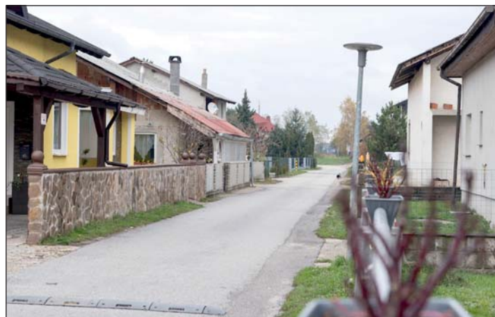
Pušča ma már önállóan működő település.

kott Pušča településre, ahol megtapasztalhatták a romák sikeres integrációját. Pušča nemcsak Szlovénia legfejlettebb roma települése, hanem egyedülálló példája az együttélés és az integráció jó gyakorlatának európai szinten is. A Muraszombat szomszédságában álló, ma már önállóan