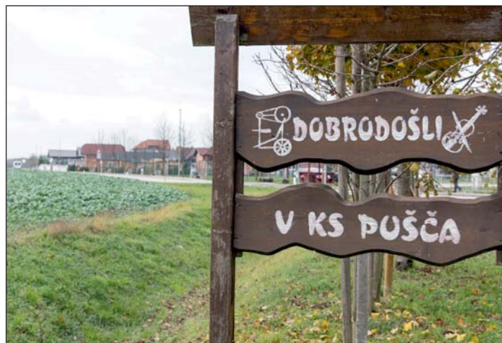
Ellátogattak Pušča településre.

hettek egymással. A szlovéniai Rakičanban , a Vezető Partner székhelyén megtartott partnertalálkozón áttekintették az eddigi tevékenységeket és eredményeket, illetve a program részét képezte egy helyi jó gyakorlat bemutatása is. A partnerek közösen ellátogattak a helyi roma közösség által la-