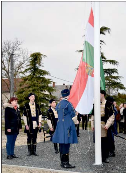
A Zrínyi Kadétok ünnepélyes zászlófelvonása Murakeresztúron.