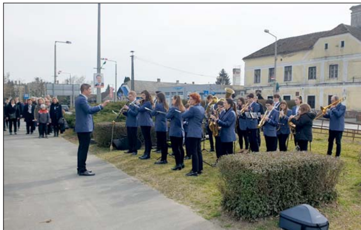
A Mura Térsége Fúvószenekar térzenét adott, majd játszott a Himnuszt és a Szózatot.