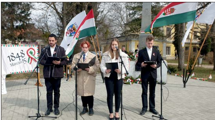
A nagykanizsai Mozaik Színpad március 15-re emlékező előadása.

A hadihelyzet változásával azonban november 11-én és 12-én ki kellett üríteni a Muraközt. De még november 24-én, az innen indított ellentámadásuk Hodosán elfoglalásával járt. Majd december 12-én a letenyei hadosztály átkelt a Muraközbe és öt napon át sikeres hadműveleteket folytatott. Mind-egy addig tartott, míg híre nem jött Windisgrätz december 14-én indított támadásának, és megkapták a parancsot a visszavonulásra. A letenyei lakosság kétségbeesésének és menekülésének emléke az 1984-ben itt előkerült 12,5 kg súlyú éremlelet (Folytatás a 12. oldalon)