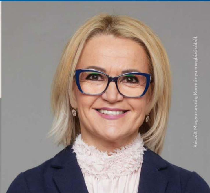
Készült Magyarország Kormányának megbízásából.