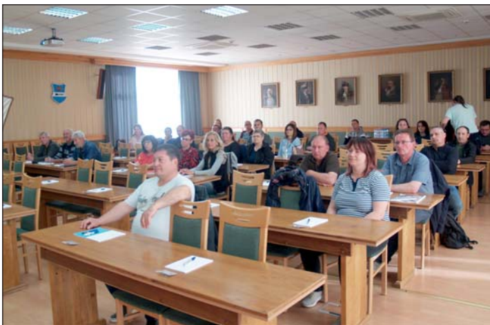
Május 27-ig tart a falugondnokok képzése.

Mára már a községi önkormányzatok nélkülözhetetlen dolgozói lettek a falugondnokok, akiknek képzése egyre