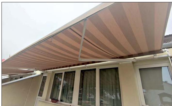
Egymillió forint értékű a nyeremény.

A szakmai zsűri és a közönség a keresztúri ovisok házat találta a legjobban sikerültnek, így nyert az óvoda