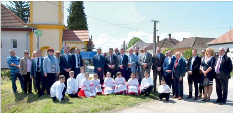
Hivatalos küldöttség is érkezett Horvátországból a kétnyelvű keresztúri utcatáblák avatóünnepségére.