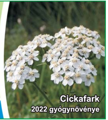
Cickfark 2022 gyógynövénye