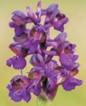
Agárkosbor 2022 vadvirága