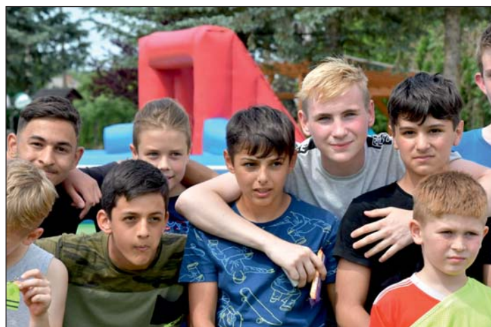
Emlékezetes gyereknapi volt...

A biciklis gyereknapon ajándékkal várták a kerékpárral érkezőket. Napközben bringás versenyeket, KRESZ-vetélkedőt szerveztek. De volt kézműves foglalkozás, biciklis tematikájú rajzverseny, csillámtetoválás, vízi-foci, sportvetélkedő, ugrálóvár is. Népi fajtákkal teheték próbára ügyességüket a keresztúriak és a rendezvényre érkező vendégek. Sok család érkezett a környező településekről is.