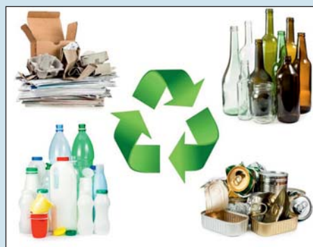
Külön iparág lett a hulladék gyűjtése, kezelése, újrafelhasználása.

– A hulladékgazdálkodás kapcsán fontos kiemelni az önkormányzatok szerepét. Nekik egyrészt a saját tulajdonú ingatlanok esetében van kötelezettségük, másrészt a beje-