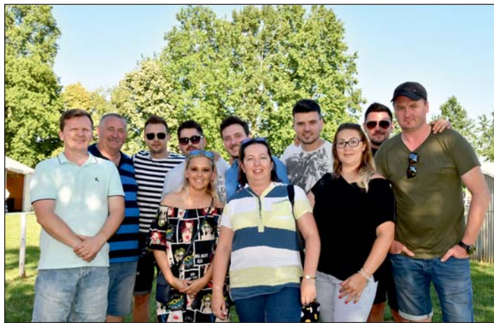
A Mejaši zenekar nagy sikerrel szerepelt.