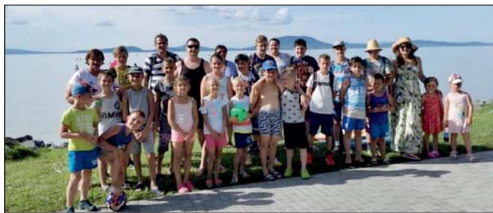
Keresztúri gyerek táboroznak az önkormányzat szervezésében a Balaton déli partjánál