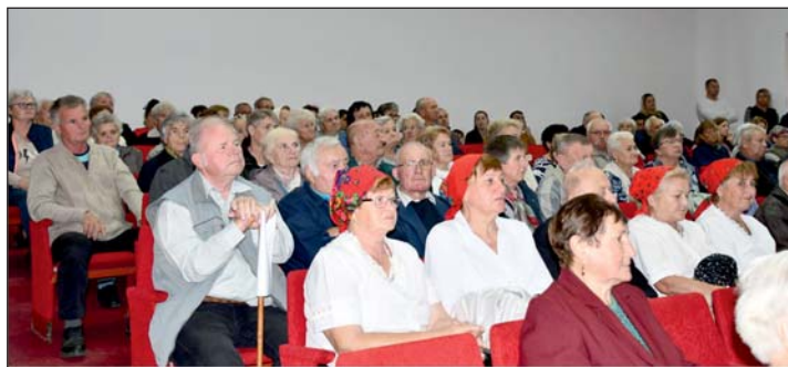
A teltházas keresztúri művelődési házban ünnepi műsorral köszöntötték a szépkorúakat.

Mi viszont úgy tartjuk, hogy minél nagyobb nehézségek várnak ránk, annál jobb teljesítményt kell nyújtanunk. Annál inkább össze kell fognunk, és mindent el kell követnünk, hogy védelmet, biztonságot tudjunk nyújtani a