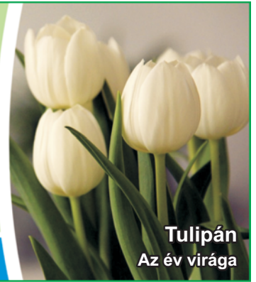
Tulipán Az év virága