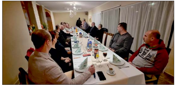
A letenyei polgárőrök is ünnepeltek.