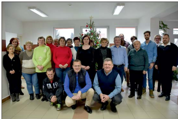
Köszönetet mondtak az önkormányzat dolgozóinak.

úriak régi vágya volt. Új utakat, járdákat építettünk, új eszközöket szereztünk be, hogy kiterjedt zöldterületünket folyamatosan gondozni tudjuk, több intézményünket is felújítottuk, saját kertészetet indítottunk, gazdasági utakat tettünk rendbe, Újtelepre napelemes közvilágítást vittünk, és még hosszan sorolhatnám. Az év végén egy közös vacsorával és egy kis ajándékkal köszöntem meg kollégáimnak, hogy a válság idején is kiválóan végezték munkájukat. Mindent megtettek azért, hogy a kedvezőtlen gazdasági helyzetben is tovább fejlődhessen otthonunk. Hálás vagyok érte, hogy ilyen kiváló csapattal szolgálhatjuk Murakeresztúrt! Folytatjuk a megkezdett munkát, tovább dolgozunk az otthonos, biztonságos, barátságos és fejlődő Murakeresztúrért!”