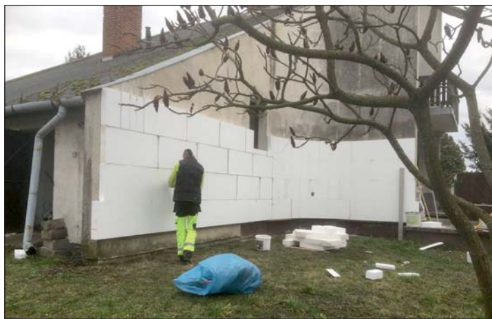
A régi gyógyszerészterület épületét újítják fel.

Murakeresztúron megkezdtek a régi gyógyszerészterület szigetelését, az épületben a Magyar Falu Program keretében új szolgálati lakásokat alakít ki az önkormányzat. A régi gyógyszerészterület épületét a kormány támogatásával vásárolhatta meg és újíthatja most fel a település.