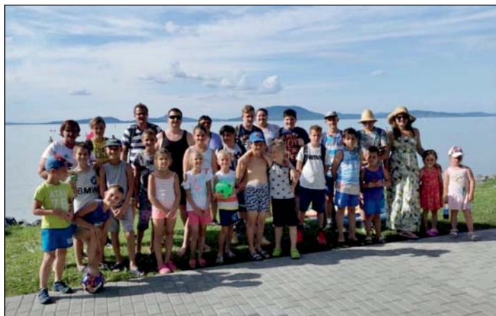
A kép a keresztúri gyerekek korábbi napközis táborozásán készült.

Összesen kilencven murakeresztúri gyerek jelentkezett, hogy részt szeretne venni az önkormányzat által szervezett nyári napközistáborokban. Nyáron több turnusban három különböző tábort is indítanak az önkormányzat szakirányú végzettséggel rendelkező munkatársai.