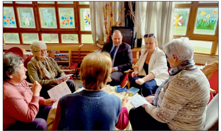
Különleges programot szerveztek.

A Bibliotéka Caféhoz a Petőfi 200 emlékévi jegyében alkalmi kiállítás is társult, ez utóbbit – melyet Farkas István József mutatott be – Petőfit ábrázoló, illetve a költő életéhez vagy munkásságához kapcsolódó szép érmeiből, plakettekből, pénzekből és bélyegekből állították össze.