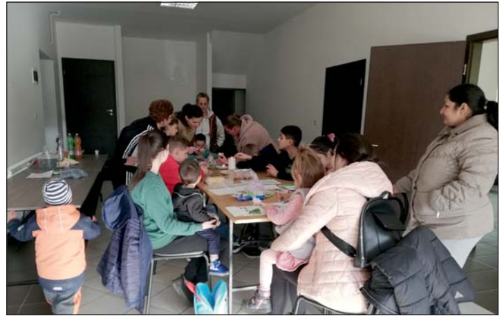
Közösen készítették el a hímes tojásokat.

Semjénházán, Nagycsütörtök délutánján közösen készítették el a hímes tojásokat, horvátul „pisanica”-t. A település Horvát Nemzetiségi Önkormányzata által szervezett eseményre a falu apraja és nagyja összegyűlt, hogy a helyi IKSZT-ben megismerkedjenek a hagyományos horvát húsvéti tojás motívumaival, s a tojásfestés rejtelmeibe is betekintést kaphattak. Elsősorban a viaszolás technikáját alkalmazták a résztvevők, melynek lényege, hogy megolvastjuk a viaszt. Ezt követően vesszük az írókát és belemártjuk a még folyékony viaszba, majd felvisszük a