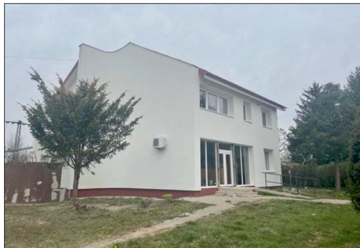
Új szakembereket tudnak majd Murakeresztúrra csábítani.

A szolgálati lakást olyan emberek vehetik majd igénybe, akik Murakeresztúrtól dolgoznak, közszolgálati munkát látnak el. Ennek a beruházásnak köszönhetően új szakembereket tudnak majd megnyerni falunak, ezzel tovább tudják fejleszteni a település szolgáltatásait.