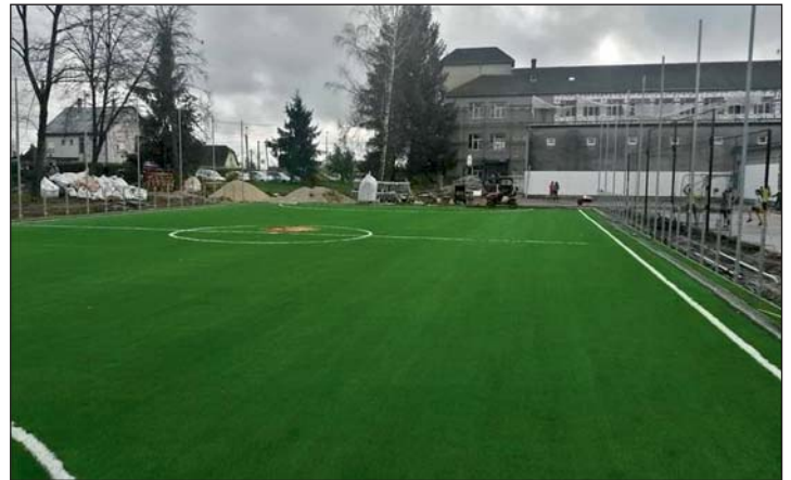
Bíznak a pályázat sikerében.

Csatlakozik az országos sportpálya felújítási programhoz Letenye Város Önkormányzata . Az átfogó program keretében már meglévő, ám karbantartásra szoruló műfüves pályák felújítására nyílik lehetőség. A felújítás 10 százalékos önrész mellett valósítható meg, Letenye esetében ez mintegy 2,5 millió forintot jelent, amit sikeres pályázat esetén 2024. évi költségve-