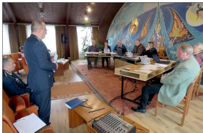
Rendőrségi beszámolót hallgatott meg a testület.

Új alapokra helyezték az önkormányzat működését, erre új szervezeti és működési szabályzat elfogadásáról döntöt-