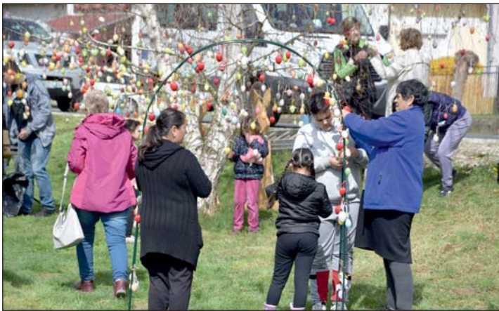
„Tojáskapuval” bővült a program.

2023. április elsején tartották a VII. tojásfa díszítést Kistolmácson.