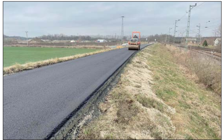
Jól haladnak a munkálatok.

sa jó lehetőséget teremt arra, hogy minél több vendéget tudjanak Murakeresztúrra csábítani. A település vezetése mindent megtesz annak érdekében, hogy felkészítsék Keresztúrt a két keréken érkező vendégek fogadására. Nemrég adtak át egy új bringás pumpapályát, korábban a focipálya mellett bringás szerviz és pihenőhely került kialakításra, de már biciklis szálláshely is van településen. A falu sportpályája és a