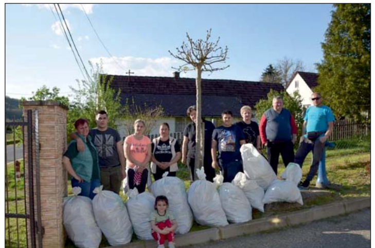
12 zsák szemet gyűlt össze...

Az egyesület fontosnak tartja a környezetvédelmet, a közösségépítést és a hagyományápolást egyaránt, ezért is vett részt a meghirdetett rendezvényben.