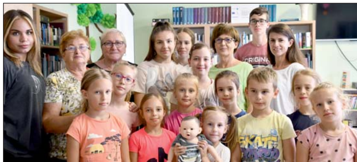
Gyerektáborban a mentősökkel és az orrossal.