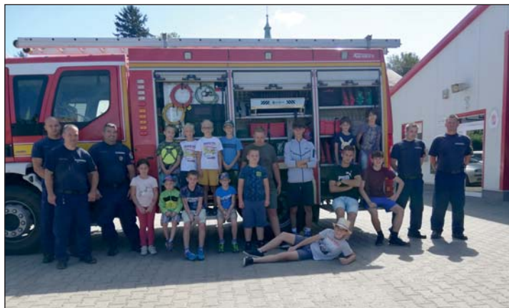
Látogatás a tűzoltó laktanyában.

Immár nyolcadik alkalommal szervezte meg nyári táborát a helyi iskoláskorú gyermekek számára Semjénháza Horvát Nemzetiségi Önkormányzata. Az 1 hetes, július