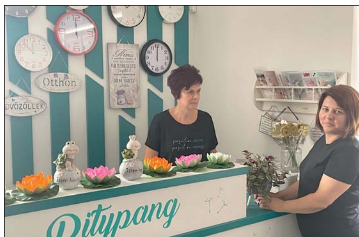
Pitypang virág- és ajándékolt.