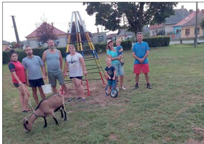
Családi és baráti összefogással újították fel a romos játszóteret Keresztúron.

„A karbantartó és közmunkás kollégáim pedig a meleg, esős időben, ami belobbantotta a természetet, reggeltől estig azon dolgoznak, hogy gondozzák, ápolják legyenek közterületeink” – dicsérte munkatársait a település vezetője. Szerinte „a játszótér felújításával Murakeresztúr megint tanúbizonyosságát tette annak, hogy miénk az egyik legösszetartóbb közösség a Mura mentén”.