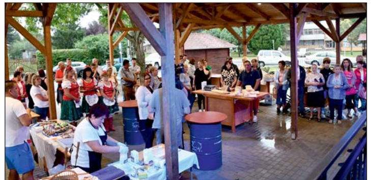
Megtelt a fedett piactér az árusokkal és az ünneplőkkel. Helyi finomságokat és igényes kézműves termékeket is lehet kapni az új piacon.

vendégek helyben tudjanak minőségi alapanyagokat, gyümölcsöt, zöldséget, pékárut, tejterméket beszerezni. Senkinek ne kelljen a városba mennie, ha finom ételekre, minőségi termékekre van szüksége. Murakeresztúr minél inkább önállóvá válhasson, a helyi kereskedőknek, termelőknek és kézműveseknek lehetősége nyíljon helyben értékesíteni terméküket. Közös sikerünk, közös büszkeségünk ez, amely nem jöhetett volna létre az összefogásunk nélkül. Minden keresztúriak, minden helyi vállalkozónak köszönöm a közreműködését” – nyilatkozta az átadón a falu polgármestere.