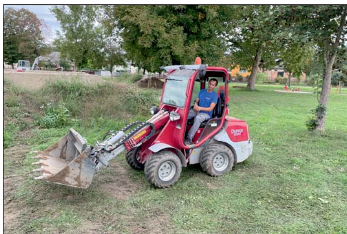
Ezt a sok munkát már csak géppel győzik a keresztúri karbantartók.

A sok esőnek és a melegnek köszönhetően belobbant a természet augusztusban a megyében. Murakeresztúr kiterjedt zöldterületének gondozása is extra erőfeszítést jelentett az önkormányzat dolgozóinak. Hogy a megnövekedett mennyiségű munkát hatékonyabban tegyék és felgyorsítsák, kölcsön kértek egy nagy teljesítményű mulcszó adaptert, amit az önkor-