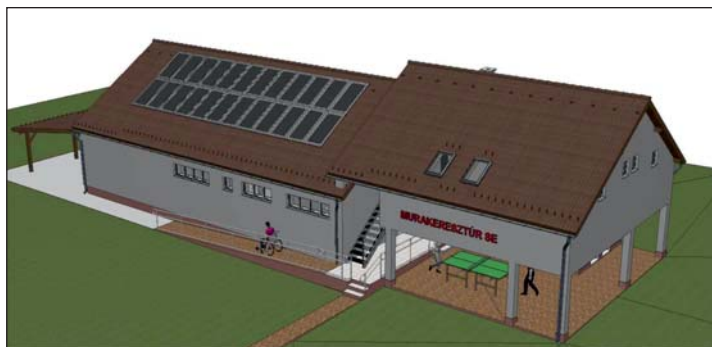
Látványterv a Deák-Gizmó Murakeresztúr SE bővülő és megújuló öltözőjéről.