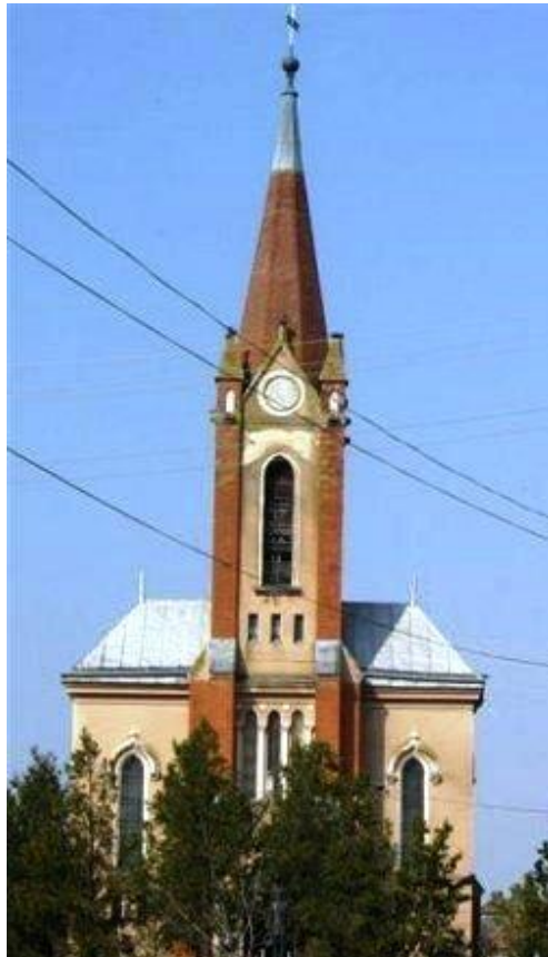
A nagypaládi református templom