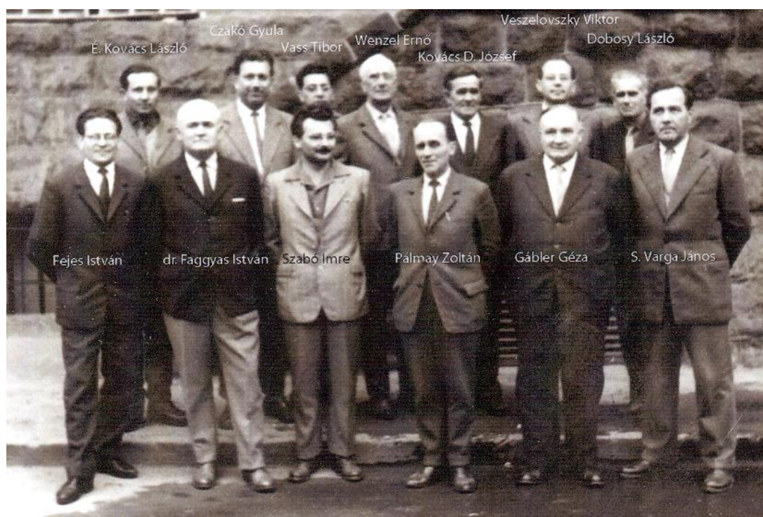
Az ózdi Olvasó Honismereti Kör alapító tagjai