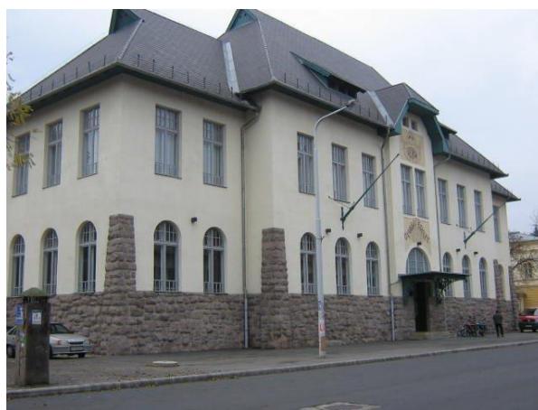
Az Olvasó épülete napjainkban