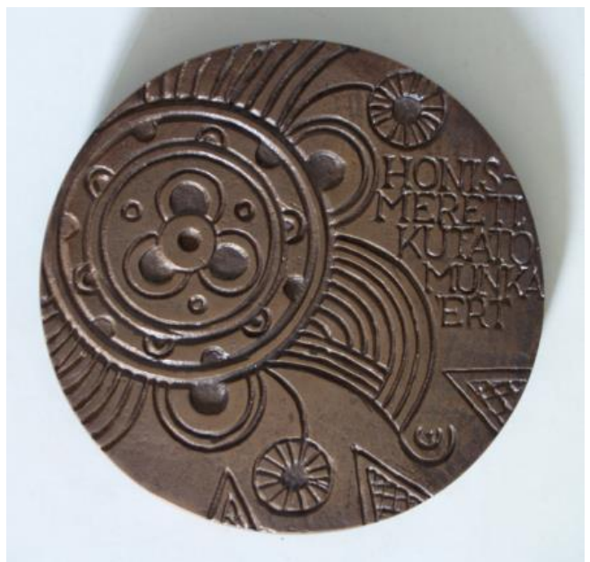
Az Istvánffy-plakett elő- és hátoldala