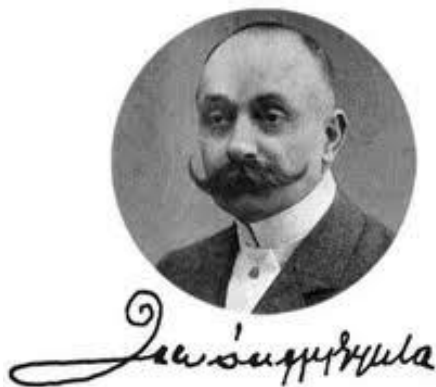
Istvánffy Gyula arcképe és aláírása

A népfrontos honismereti mozgalom pozitívumai között szerepelnek: a nemzeti identitás erősítése, a történelemszemlélet fontosságának hangsúlyozása és nemzeti múltunk vállalása. De a jövő mégis a civil kezdeményezések felé mutatott. Az 1990-es évektől már nem volt szükség a HNF védőernyőjére.