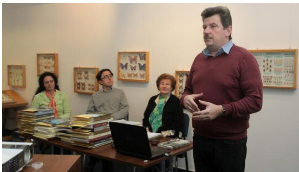
Díjkiosztó a Pannon-tenger Múzeum termében

A rendszerváltás után, egészen 2011-ig a megyei önkormányzat Mecénás Kiemelt Alapja nyújtott anyagi támogatást a gyűjtőpályázat meghirdetéséhez, lektorálásához, ünnepélyes díjkiosztásához és a megérdemelt díjak biztosításához. Az ünnepélyes díjkiosztások kezdetben a Múzeumi (és Műemléki) Hónap megyei megnyitójához szervesen hozzátartoztak. Majd a március 15-i ünnepi rendezvények részévé vált, mostanság pedig az október 23-i ünnepségek adnak alkalmat a gyűjtőpályázat résztvevőinek találkozájára és jutalmazására. A pályázatok értékelésére és a díjkiosztásra hol a Herman Ottó Múzeum előadótermeiben, hol a megyeháza dísztermében vagy a Miskolci Akadémiai Bizottság konferenciatermében került sor ünnepélyes keretek között. Manapság e rangos megyei eseménynek a miskolci Pannon-tenger Múzeum foglalkoztató előadója biztosít helyet.