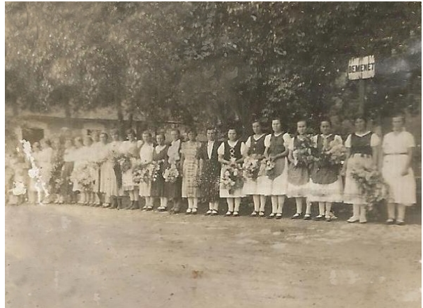
Új harangra várók a nekézsenyi vasútállomáson

Az 1914–1918 közötti időszakban szinte minden templomtoronyból, haranglábból vittek el harangokat. Még a kisebb súlyúakat sem kímélték. A nekézsenyi reformátusoktól elrekvirált harangról készült Bizottsági jegyzőkönyvből tudható, hogy az 1915. február 14-én elvitt harang súlya mindössze 19 kg volt. 9 A háború után az egyházközségek, a hívek igyekeztek minél előbb pótolni harangjukat és ünnepélyes keretek közt fogadták azt.