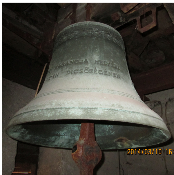
A dédestapolcsányi református templom újraöntött harangja

„AZ 1914–18 ÉVI VILÁGHÁBORÚ CÉLJAIRA ELVITT/ HARANGJA HELYÉBE KÉSZITETTE A/ DÉDESI REF. EGYHÁZ/ ISTEN DICSŐSÉGÉNEK SZOLGÁLATÁRA, 1923.” 11