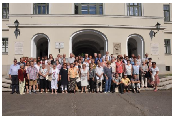
Csoportkép a zárónapon