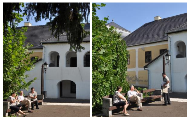
A rendezvény helyszínének, a református teológiának az udvarán