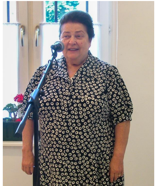
Mezőkövesdi kiállítás megnyitón (2008)

1994–2005: óraadó tanár az Iparművészeti Egyetem Textiltervező Tanszékén