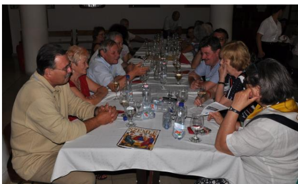
Vacsora előtt a polgármesteri fogadáson megyebeliek körében