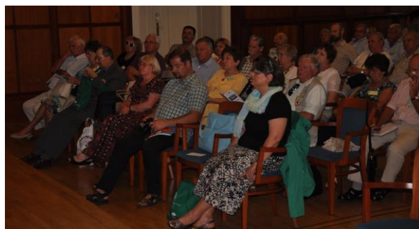
A rendezvény hallgatóságának tömegében (bal szélén a 3. sorban)