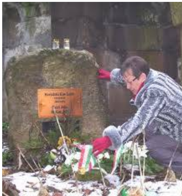
Marjalaki Kiss Lajos sírjának megkoszorúzása 2012-ben

Miskolc város vezetése is hálával emlékezik rá, sírját Miskolc város napján, május 11-én rendszeresen megkoszorúzza a város mindenkori polgármestere és a Zrínyi Ilona Gimnázium vezetősége.