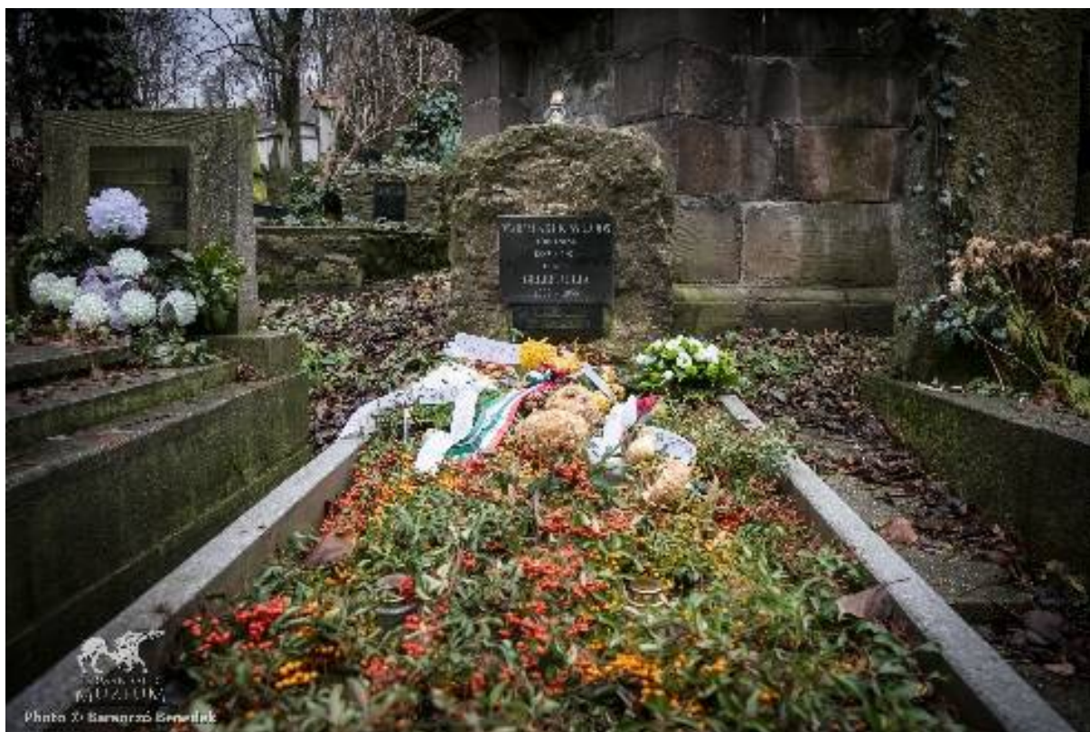
Marjalaki Kiss Lajos sírja 2017-ben