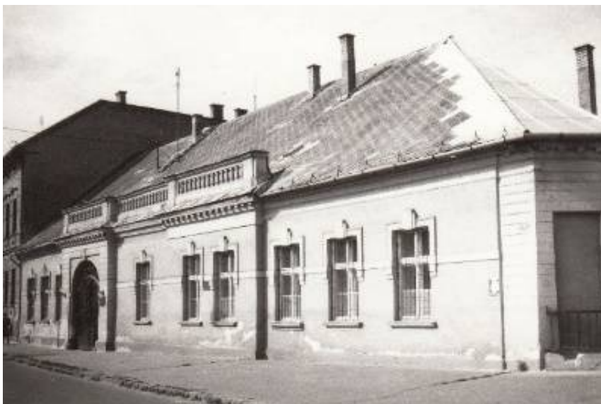
A miskolci 2. sz. polgári iskola (Frisnyák Sándor, 1970 körül)

Igen emlékezetesek a tantermen kívül tartott történelemórái, a tanulmányi séták, az emlékhelyek és a közgyűjtemények felkeresése. A