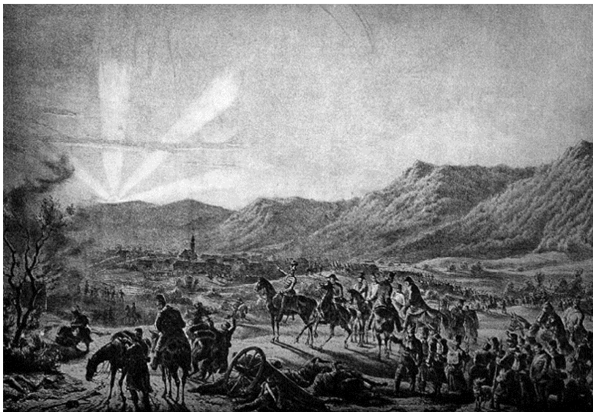
Schlik Kassa előtt

Magistratus = A városi tanács ügyiratai és levelezése (1848–1849)