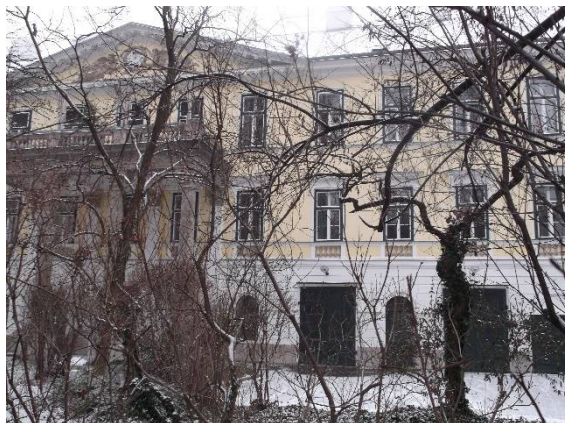
Az egykori Walter-villa (ma: Salm-Reifferscheid-palota kertje Bécsben, 2019. január,)