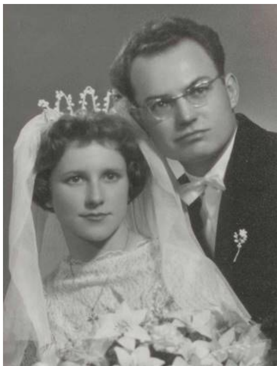
Esküvői kép