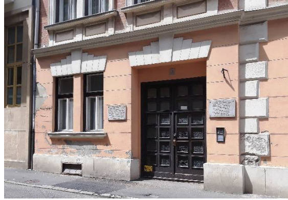
Kossuth utca 3. szám.