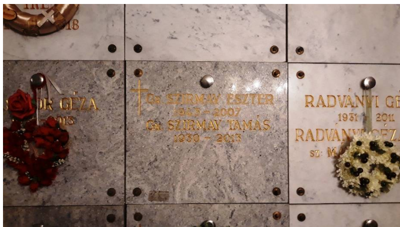
Szirmay Eszter nyughelye a miskolci Minorita templom alagsorában lévő kolumbáriumban.