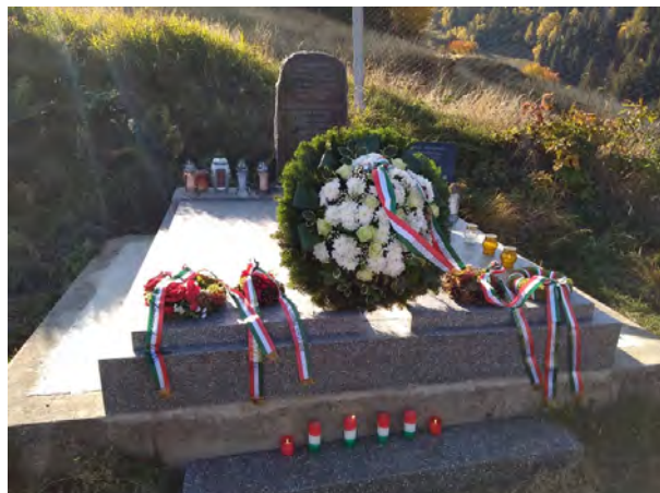
A csépanyi katonák felújított síremléke Klenóc-Pusztarét temetőjében