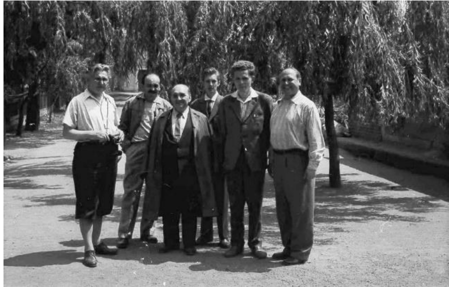
Honismereti szakkörvezetők találkozója, Hejőkeresztúr, 1962.

A Néprajzi Adattár gyarapítása mellett meg kell említeni a tárgyi gyűjtemény gyarapításában kifejtett tevékenységét is. E téren elsősorban a kovácsok eszközkészleteit és kovácsmunkákat kell kiemelni, melyek halálát követően gazda nélkül maradtak, hiszen fő témáját, a fémművességet senki nem folytatta. De közel sem csak ezeket gyűjtötte, a tárgyi néprajz minden területére odafigyelt.