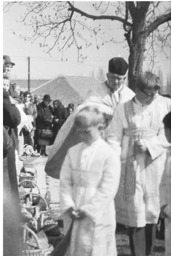
Húsvéti ételszentelés Miskolc-Görömbölyön.

Kutatási témáit is nagyon gyakran miskolciságának tudatában választotta. Már 1952-ben (elsőéves egyetemistaként) megkezdte – a gönci kovácmesterség mel-