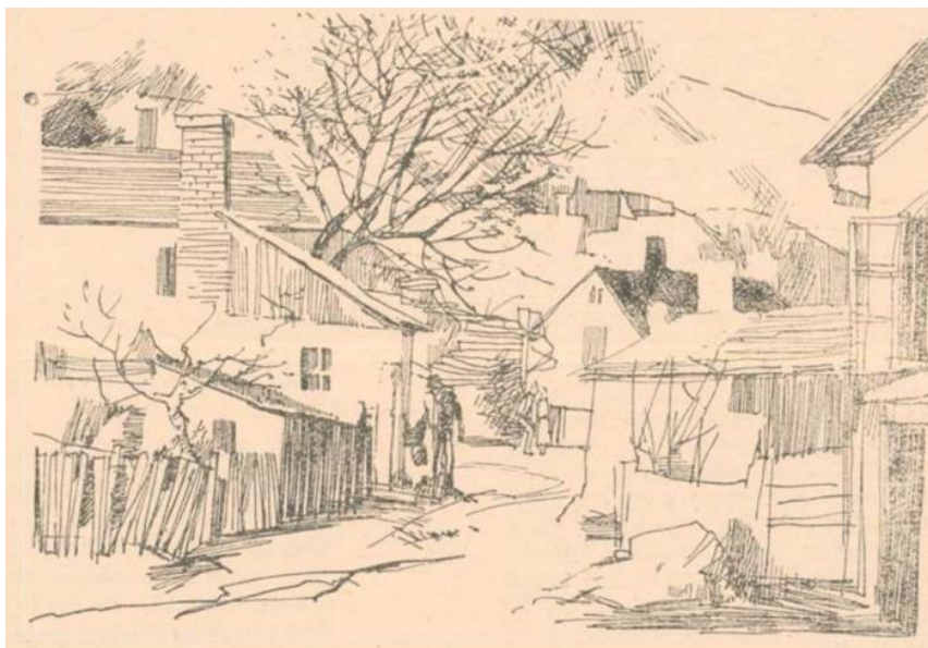
Bodgál Ferenc rajza: A mi Tetemvárunk (Napjaink 1962/2. /május/ 12.)