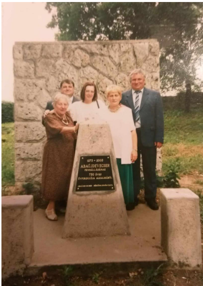
Abaújdevecser fennállásának 730 éves évfordulója alkalmából elhelyezett emlékoszlop

Az 1600-as évektől kezdődően négy földbirtokos család töltött be fontos szerepet az évszázadok során a falu életében. Jelentőségük óriási, hiszen a Putnokiak, Csomák, Fáyiak, Nyulásziak mindannyian jelentős földbirtokkal bírtak, ezáltal épített örökségük és szellemi hagyatékuk nagyban meghatározta fennmaradásunkat. Ezek a hagyatékok a település dicső éveire emlé-