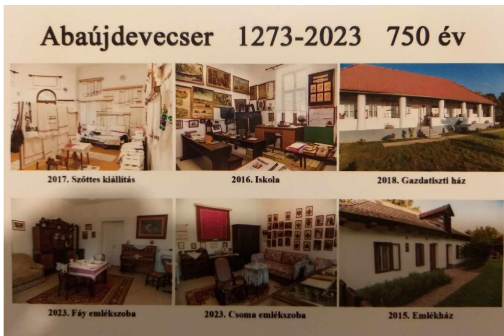
Az abaujdevecseri gyűjteményeket bemutató képeslap

létre, hogy begyűjtöttük a lakosságtól a számukra fölöslegessé váló könyveket, és rendszerezzük azokat.