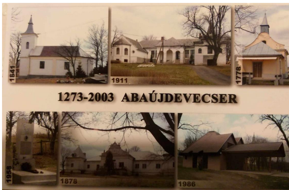
Képeslap a 730 éves Abaújdevecser épített örökségeivel