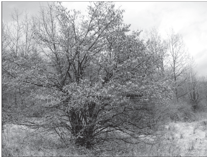
2. ábra: Császármadár élőhely 2010 tavaszán

2010.III.12-én a hívatásos vadászok a mintaterületen kívüli területeket vizsgálták meg. Friss császármadár nyomot nem találtak. A korábban beazonosított éjszakázó fákat megkeresték és meggyőződtek annak a valószínűségéről, hogy a madarak a környéken tartózkodnak. Több napos hulladék csomókat találtak ezen a környéken, de császármadarat nem sikerült megfigyelniük.