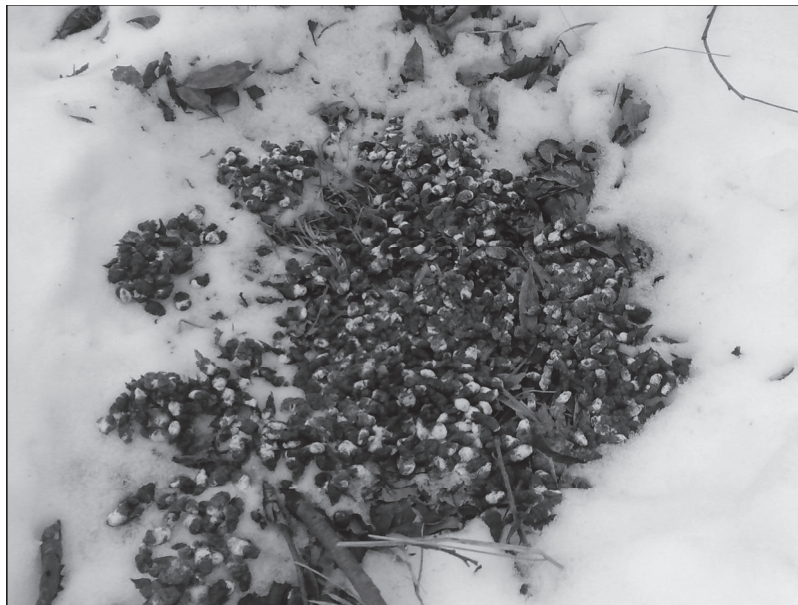
1. ábra: Császármadár ürülék

2010.III.27-én délelőtt a foglalt kút környékén még mindig vastag a hótakaró (átlagosan 15-20 cm). Jól kivehetőek voltak a régebben használt hóvárak maradványai, nagyon sok ürülékkal a környéken ( 1. ábra ). A hatalmas ürülékkupacok a madarak jelenlétét bizonyítja.