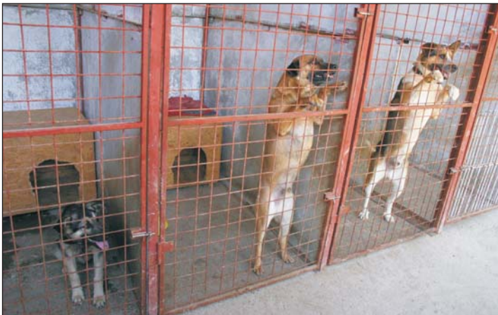
A befogott állatok másfél négyzetméteren sínylődnek.

Az elmúlt hónapokban vihar dült – s tán még most is tart – a zalaszentgróti gyepmesteri telep körül. Szerkesztőségünkhez eljutott információk szerint nincs megfelelő állapotban a telep, nincs a fenntartó önkormányzatnak szakembere, aki felelős lenne a kóbor ebek begyűjtéséért, no és a befogott állatok élő lényhez méltó gondozásáért és elhelyezéséért.