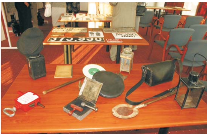
Vasúti relikviák a Termál szállóban nyílt tárlaton.

Rendhagyó kiállítás nyílt május 13-án a Kehida Termál Gyógy- és Élményfürdő szállodájának konferenciatermében. A látogatók vasúti relikviákkal találkozhatnak a Zalavölgyi Vasút történetéből. Az egykor Türjétől Zalaszentgróton át Balatonszentgyörgyig vezető vasúti szakasz tavaly december 15-én telt ki, de a 115-ik „életévét”. Létére ma már csak az egykori állomásépületek emlékeztetnek, no és azok az emberek, akiknek a szí-