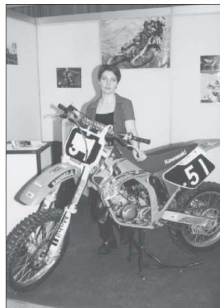
Már csak emlék a motor...