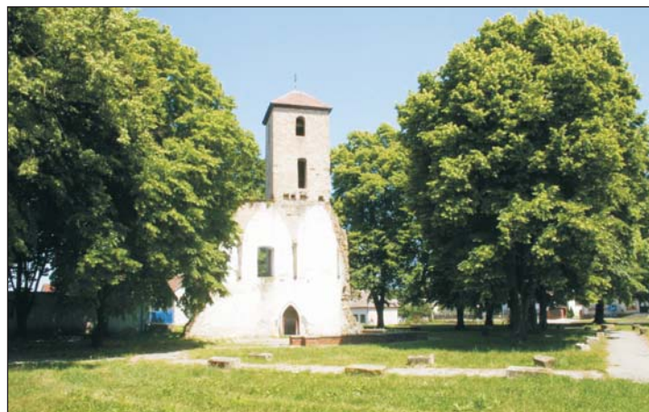
A kisszentgróti romtemplom, ahonnan az Ivó-napi túra indul.

negyedévenként sora kerülő hagyományos nyugdíjas dalárda következett tangóharmonikával, felelevenítettük a régi magyar nótákat. A dalárdába egyre több fiatal is bekapcsolódik. Az Anyák Napja ünnepséget évek óta a helyi templomban tartjuk, idén is így történt, a kisszentgróti gyerekek kedvesedtek az anyukáknak és nagymamáknak. Egész éven át számos rendezvényre kerül sor. Így például május 22-én megtartották a hagyományos Ivó-napi túrát, június 26-án nyugdíjas találkozó lesz, augusztus 20-án kisszentgróti főzőcske színesíti szent királyunk ünnepe, s jön az őszi szüreti fesztivállal, ultiversennyel, s a téli angyalváró teadélutánnal és egyéb rendezvényekkel.