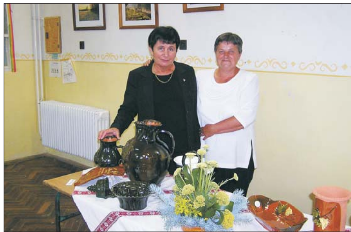
Remény van arra, hogy fesztivál legyen...