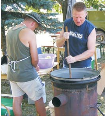
Készül a vacsora...

A rekkenő hőségben bágyadt mozdulatlanság ült a Zalavölgyi falvakon. Július 9-én délután kettőkor Batykon is csak a polgármesteri hivatalnál tapasztaltunk némi aktivitást, velünk egy időben érkeztek a testvérközség, Sopronnémeti küldöttei egy mikrobusszal. A hivatal udvarán már minden készen állt, ami a falunap megrendezéséhez kellett. A rendezvénysátor alatt lassan gyülekeztek az em-