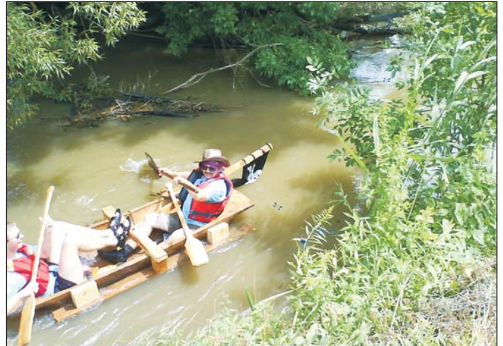
Nagyszerű szórakozást ígér az idei vízitúra is.

lódo rendezvények. Július 29-én, pénteken rockkoncertekkel és diszkóval indítanak a szervezők, 30-án, szombaton