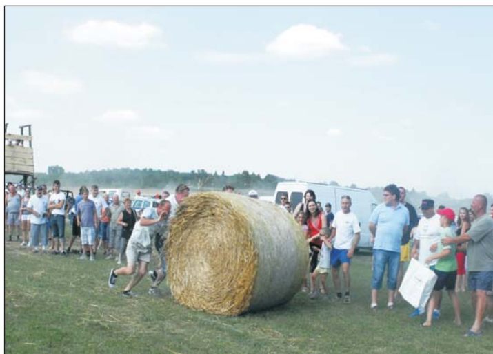
A fesztivál bővelkedett szórakoztató programokban.

A Pogácsa Fesztivál első alkalommal hét éve Zalaszentgróti tekényei városrészének részönkormányzata által került megszervezésre, majd 2007-ben már pályázati forrásból az „ Összefogás Tekenye ” alapítvány szervezésében zajlott a program. A támogatás és az alapítvány forrásai által nyílt lehetőség térségi kulturális-gasztronómiai hagyományörző fesztivál lebonyolítására. Idén már önálló településként, az önkormányzat és az alapítvány példás együttműködésével, s a régóta kitartó támogatók bizalmát is élvezve szervezték a Zala-völgye kiemelkedő fesztiválját. Az idei, július 16-i program már Pogácsa és Fröccs Fesztiválként , s egyben a Zalaszentgróti Kistérség településeinek találkozájaként is zajlott, mondván: a pogácsára jól esik a jó magyar borból készített fröccs, s a vándorló térségi összefogás pedig ezúttal Tekenyére „látogatott”.