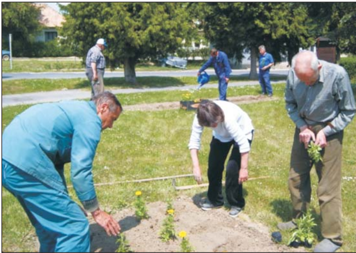
Részt vállalnak a faluszépítő munkából.

A Zala Megyei Önkormányzat által alapított és fenntartott kehidakustányi szocioterápiás intézmény ellátási területe egész Zala megye. Kizárólag szenvedélybetegek ápolását, gondozását, rehabilitációs intézményi és rehabilitációs célú lakóotthoni ellátását végzi.