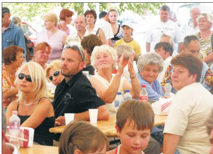
Emlékezetes hétvége volt Tekenyén.

A fiatalokat amolyan „gyerekparadicsom” várta, ahol lehetőség volt falmászásra, trambulín és bungee trambulín kipróbálására, légvár-csúszdában való játékra, gyöngyfűző, agyagzó és fafaragó foglalkozásokra, lufihajtogatásra, arcfestésre, íjászatra Oduval és együtt nevetni a színpadon Tüsi bohóccal . Délelőtt a Gyurkóvári