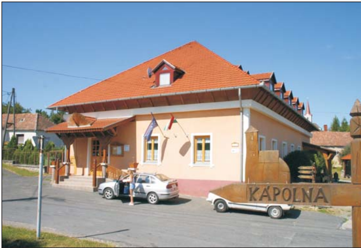
A falu- és kézművesház a kulturális programok megrendezésére szolgál.

Történelmi múlttal dolgoznak a jövőjükért