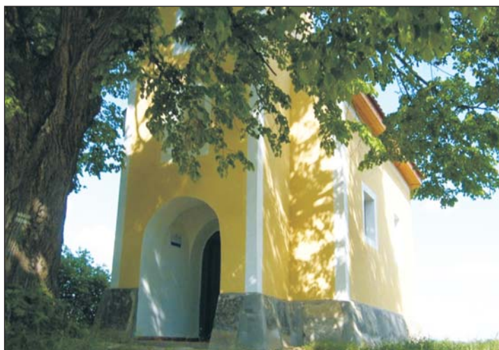
A Szent Antal kápolna.

A katolikus egyház egyik legnépszerűbb szentje Padovai Szent Antal . A főként szegények védőszentjeként tisztelt ferences szerzetesnek komoly kultusza van Zalabéren . Egy régi uradalmi épület – ma vendégház – homlokzatát az ő szobra díszíti és a szőlőhegyen emelt kápolnát is Szent Antal oltalmába ajánlották. (Megjegyzendő: szent Orbán és Donát gyakoribb, elismertebb védői a szőlőskerteknek.)