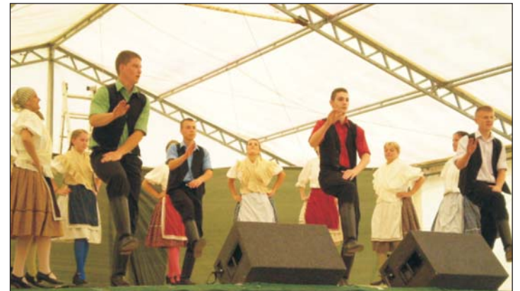
Hagyományörző programok szórakoztatták a közönséget.

A program utcabállal és sztárvendég előadásával zárult.