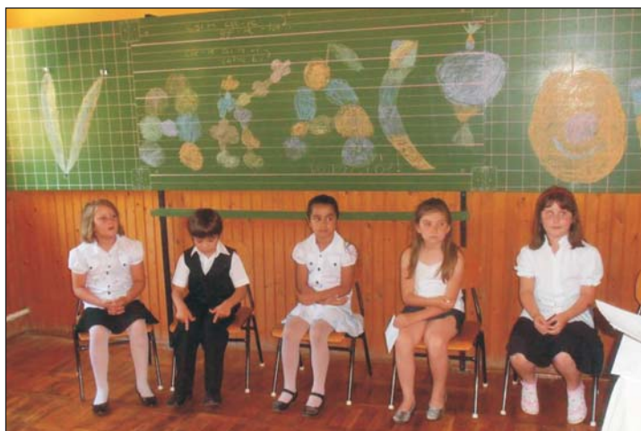
Műsort is adtak a gyerekek.