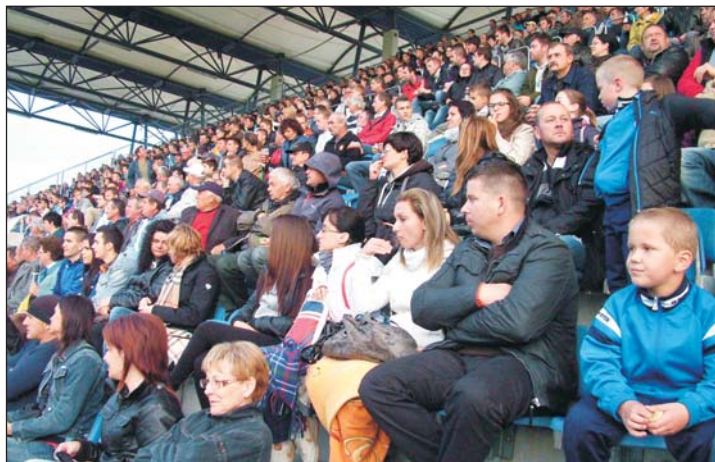
Mintha NB I-es meccs lenne az egerszegi stadionban: lelátói kép a Zalaszentgrót-Andráshida megyei döntőn.

– Aranyérmesek lettünk a megyei I. osztályú bajnokságban, s nekünk ez volt a legfontosabb. Nagyon régen nyertünk már megyei bajnokságot, s ez most sikerült. Következett a Magyar Kupa megyei döntője, majd az osztályozó az NB III-ba jutásért. Szerintem ver-