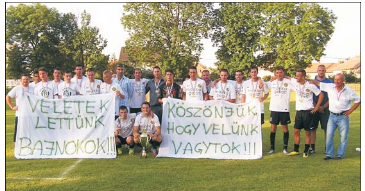
Köszönet a szurkolóknak...

A zalai labdarúgás üde színfoltját jelentette a 2012/13-as bajnokságban a Zalaszentgrót csapata, amely előbb meg-