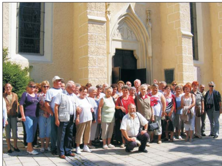
Tartalmas kiránduláson vettek részt a tekenyeiek.

Érdeklődni lehet: 92/596-936, 8-12 óráig, illetve 30/378-4465.