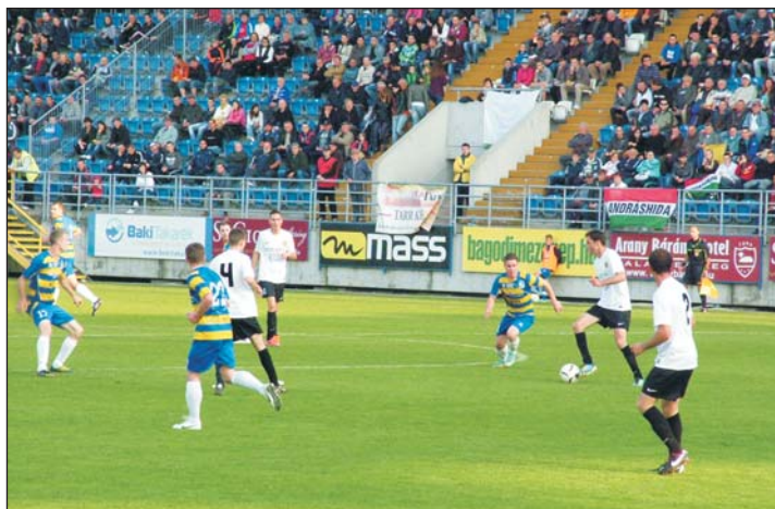
A Magyar Kupa döntőjében nagy csatára készítették az NB III-as Andráshidát.

senben voltunk a harmadosztály második helyén végzett Andráshidával, az osztályozón pedig azzal az Újbudával találkoztunk, amely egyértelműen jobb csapat, mint a miénk. Tudásunkhoz, erőnkhez képest maximálisat nyújtottunk, s ezért elismerés jár a csapatnak. Ezt az évet csak csillagos ötössel lehet értékelni.