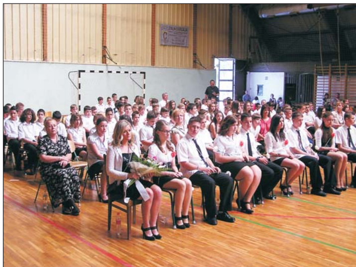
Vonzó iskolává vált a térségben...