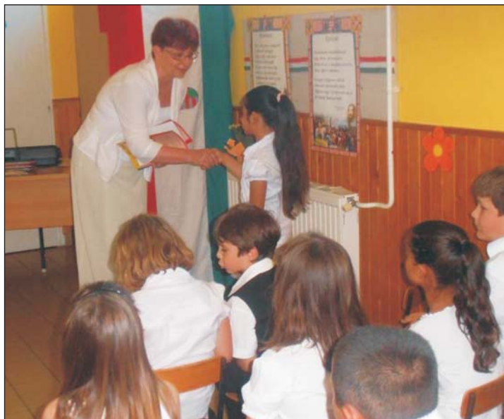
Valamennyi diák könyvjutalmat kapott.

2013. június 17-én tartották meg a Szent László Alapfokú Oktatási Központ Túrje, Batyki Tagintézményének tanévfáró ünnepségét. Az iskolában jelenleg 10 gyermek tanul első, második és harmadik évfolyamon összevont osztályban. Ezen belül 3 első, 4 másodikos és 3 harmadikos osztályos diák alkotja a intézmény létszámát.