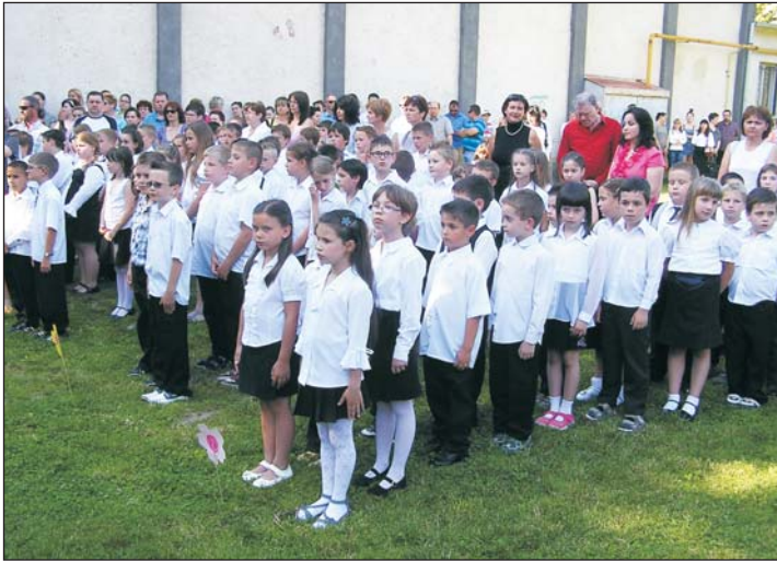
Az alsósok a tanévzárón.

Eredményesen zárta első, 2012/13-as tanévét a 460 tanuló befogadó zalaszentgróti Deák Ferenc Többcélú Térségi Oktatási Központ . Különösen a kétkedés, sőt „ellenszél” dacára megmentett középiskolai oktatásnak örülhetünk.