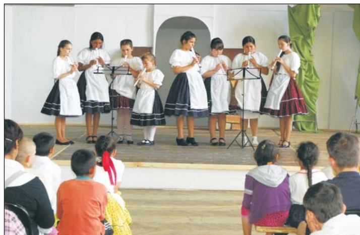
Ezen a napon a gyermekek művészetekben mutatták meg tehetségüket.

sem változott. A kezdő napon biciklitúrán vehettek részt az érdeklődők, hétköznap esténként színházi előadásokon, koncerteken szórakozhattak a vendégek, majd a hétvégén egész napos programokkal, országos hírű zenekarokkal találkozhattak a látogatók. Nagy öröm számunkra, hogy egyre több civil szervezet segíti a munkánkat, csatlakozik be a programáradatba és többek között az ő segítségüknek köszönhetően is tud, egyre sikeresebb lenni a rendezvény. Így mi már most is biztosak vagyunk benne: a jövő évben is mindenképp lesz Zalavölgyi Kultúrtivornya!