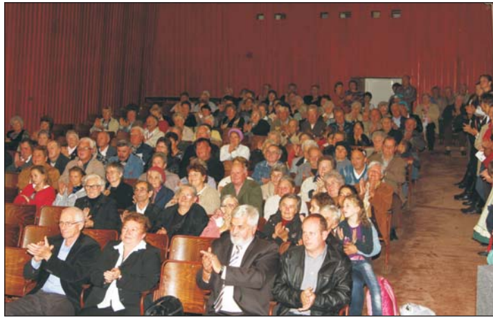
Megtelt a művelődési ház nagyterme az ünnepeltekkel.

– A hivatal működésén keresztül biztosítjuk, hogy nyugdíjasaink hozzájussanak azokhoz a normatív támogatásokhoz, melyet az ország szociális ellátó rendszere lehetővé tesz. (Szociális étkeztetés, házi- illetve jelzőrendszeres segítségnyújtás.) Biztosítjuk, hogy csekély térítési díj ellenében képesek legyenek lakásukban emberhez méltó életet élni.