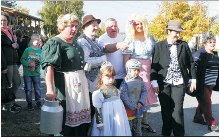
A Cserép család jelmezben...