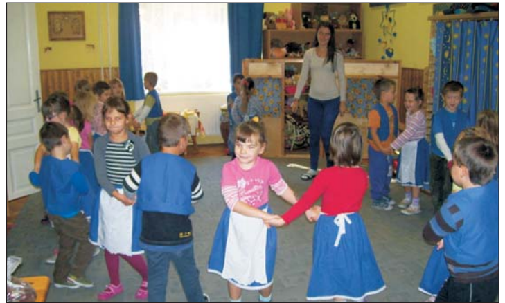
Játszva tanulnak, fejlődnek a kicsik.