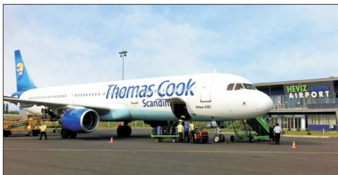
Fontos szempont a sármelléki repülőtér fejlesztése is.

- Az elnyert ÁROP pályázat alapján a tervezési feladatokkal 2014. szeptember 30-ig kell végeznie a Zala Megyei Önkormányzatnak, melyek közül a területfejlesztési koncepció már elkészült, a területfejlesztési program véglegesítése pedig 2014. I. negyedévében várható. Az elkészített dokumentumok folyamatosan nyomon követhetők az önkormányzat www.zala.hu weblapján.