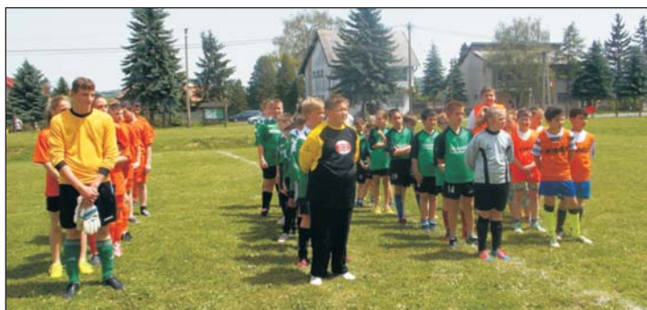
A négy csapat a megnyitón.