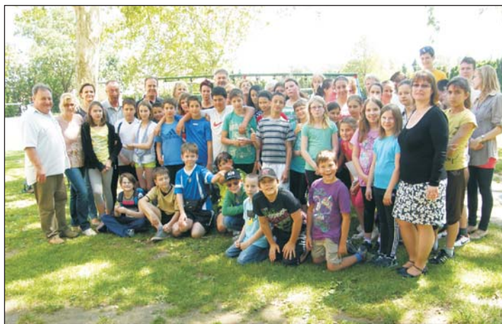
A két iskola diákjai, tanárai, kísérői.