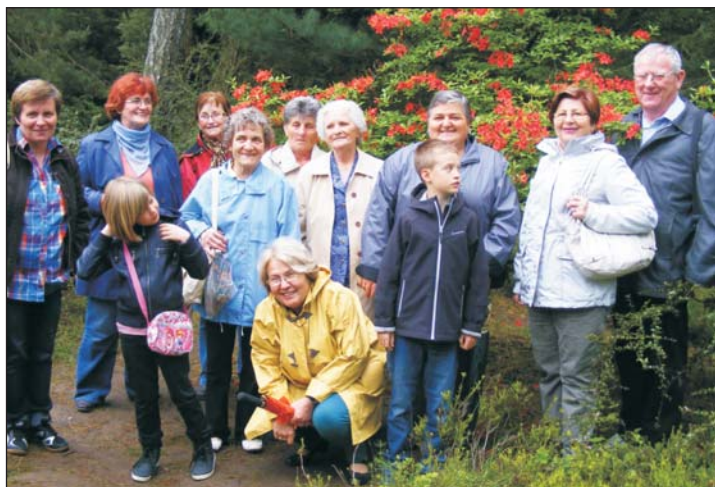
Emlékezetes kiránduláson vettek részt a tekenyeiek és türjeiek.