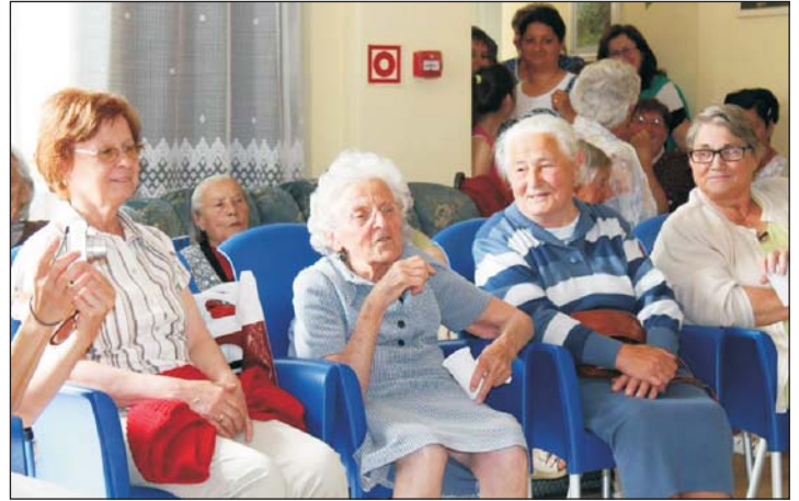
Ünnep volt a Szent Rita Idősek Otthonában is.