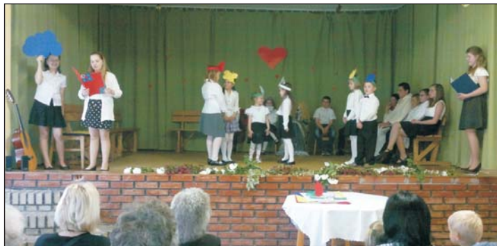
Megható volt a gyerekek anyák napi műsora.

Jókedvű zsvajv töltötte meg a szépen feldíszített tekenyei kultúrotthon május 9-én dél-