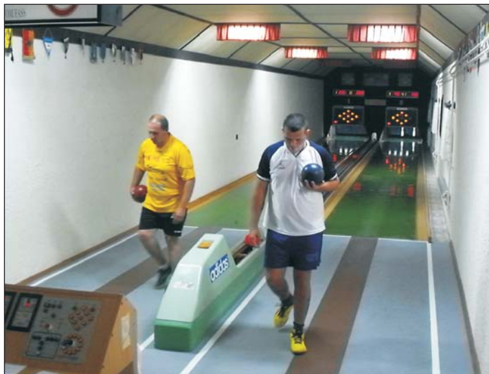
A zalakarosi (sárgában) és a pókaszepteki csapat is képviselte magát a versenyen.