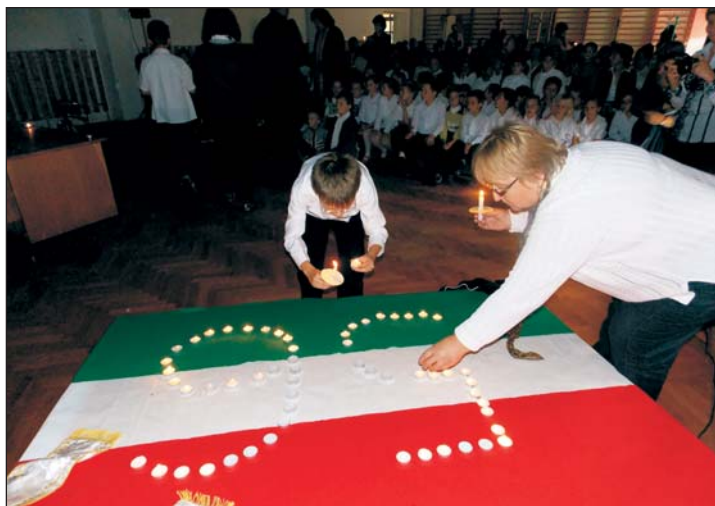
Kigyúlnak a megemlékezés fényei....

Megemlékező műsort tartottak az 1956-os forradalom hőseinek emlékére a kehidakustányi Deák Ferenc Kulturális Rendezvény és Közösségi Házban . A szervezők, a Kehidakustányi Turisztikai Egyesület és az önkormányzat színvonalas és egyben megható programot állítottak össze.