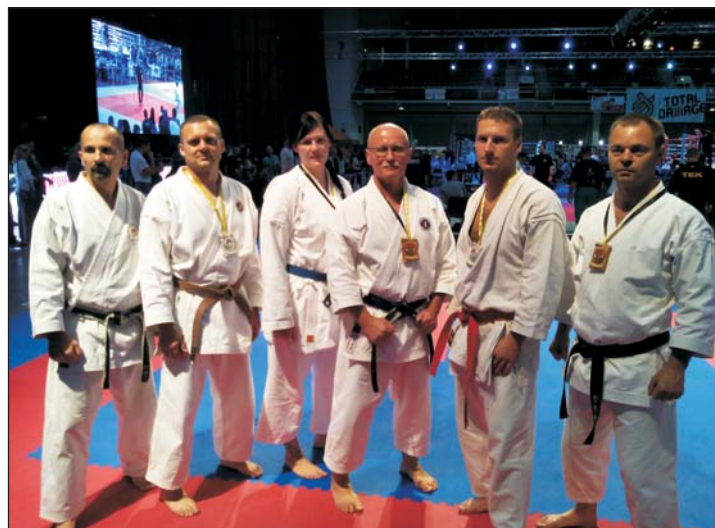
A zalai rendőrcsapat.