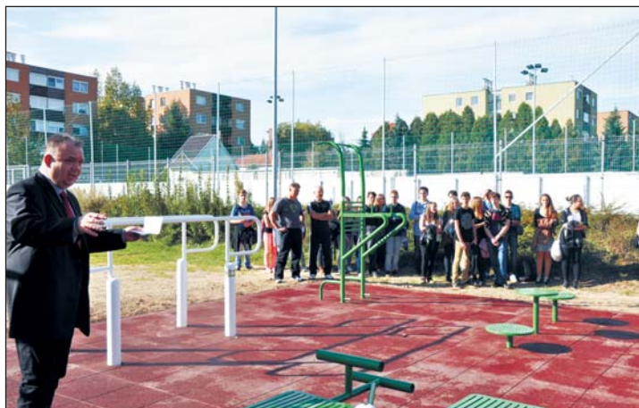
Papp Gábor polgármester adta át az edzőpályát, ahol mindjárt bemutatót is tartottak.

Szabadtéri edzőpályát adott át minap Hévízen Papp Gábor polgármester.