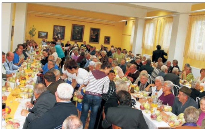
Több, mint 200 nyugdíjas vett részt az ünnepségen.