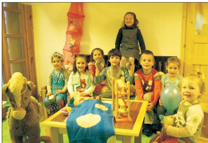
A gyerekek jól felszerelt, szép környezetben töltik napjaikat.

Öt év szünet után, 2012 augusztus elsejével nyílt meg újra Zalaszentlászlón az óvoda, mely idén ősztől már egységes óvoda-bölcsődeként működik. Jelenleg három bölcsődés gyermeket járatnak az in-