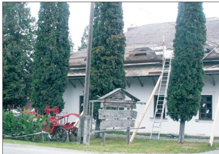
A jubileumra mindent szeretnének helyreállítani az épületen.

– Nem szorultunk adósságkonszolidációra, a kárpótlásként kapott 10 millió forintot a faluházra szeretnénk fordítani. A tetőszerkezetben és az ablakoknál beázások vannak, a lemezelés pótlása már elkezdődött, a tető után a külső festés, mellékhelyiségek, vizesblokkok felújítása, esetleg belső festés valósul majd meg. Az egész faluházat nem tudjuk felújítani, de legfontosabb teendőket a helyi iparosok bevonásával szeretnék elvégezni, akiknek nem kell útiköltséget fizetni és az ő foglalkoztatá-