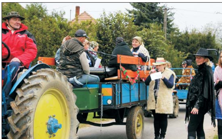
A kisbíró ismertette a falu történéseit.

A felvonulás után a kultúrházban a türjei és a zalabéri dalkör, majd a helyi asszonykórus adta elő műsorát. Este jótékony célú batyusbált tartottak az Ifjúsági Klubban, melyre szép számmal érkeztek a falubeliek. A fiatalok már készülődnek a karácsonyi műsorra, melyre idén is szeretettel várják a lakosságot.