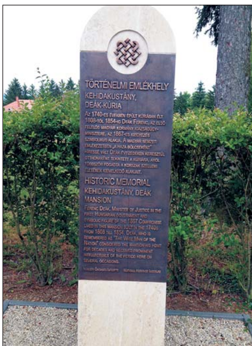
A történelmi emlékhelyet jelző sztélé.

A rendezvénysorozat első programja az október 13-án megtartott, a környék általános iskoláinak meghirdetett versmondó verseny volt. Két kategóriát hirdettek a szervezők: „Reformkori költők” és „Mai költők a reformkor eszméiről” címmel. Kategóriánként került ki az első há-