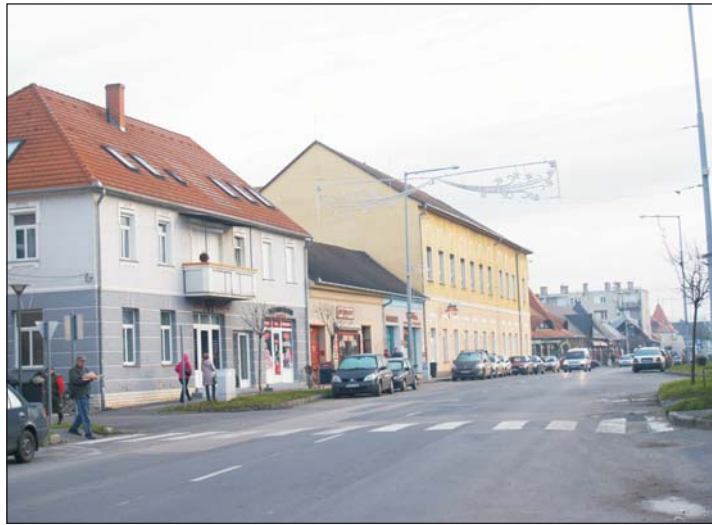
A képviselő úgy véli, hogy a polgármester teljesen feleslegesen hergeli a szentgrótiakat.