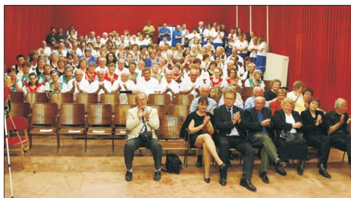
A dalkörök kölcsönösen megtapsolták egymás produkcióját.