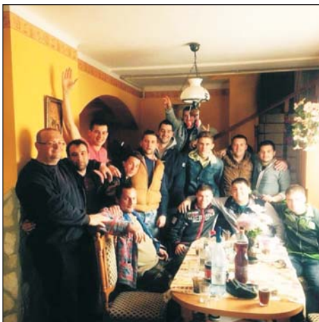
A batyki locsolók csoportja.

Valakinek a pincéjébe, másnak az udvarába folyik az összegyűlt csapadék, a vízóraaknak rendszeresen tele voltak. Megkértük a Közütkelőző Zrt.-t, hogy próbálják megoldani ezt a problémát, mert az árok az úthoz tartozik. A Zalabér és Zalaszentgrót közötti külterületen a magasabban fekvő, nem kellő irányban művelt földről ren-