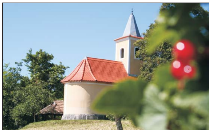
A Szent Antal kápolna egyik legnagyobb értéke Zalabérnek.

illetve a ZalabÉrték Egyesület alapító okiratában is határoztak a települési értékek állagmegővéséről, védetté nyilvánításáról.