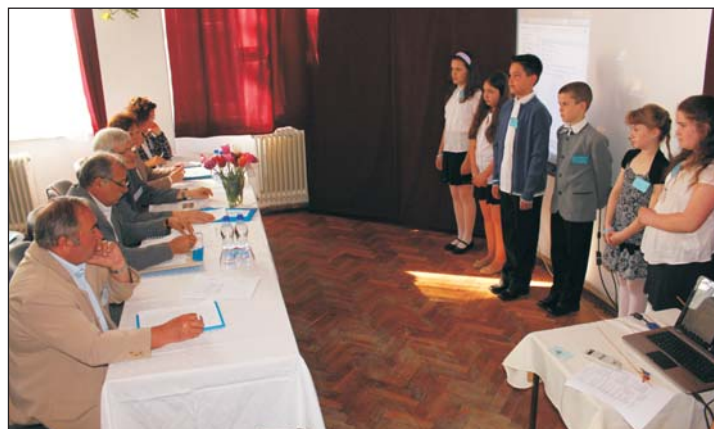
A zsűri értékelte az előadók produkcióit és útmutatást adott a továbblépéshez.