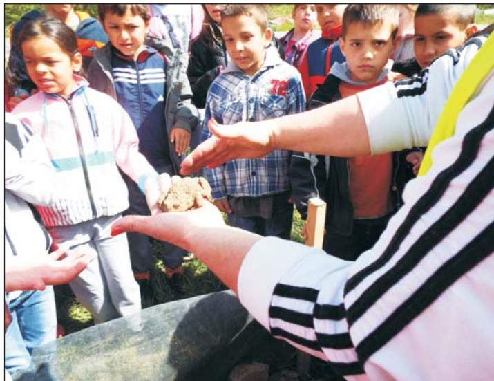
A gyerekek meg is simogatták a megmentett békákat.

Évente összefognak a békák mentéséért Zalacsányban