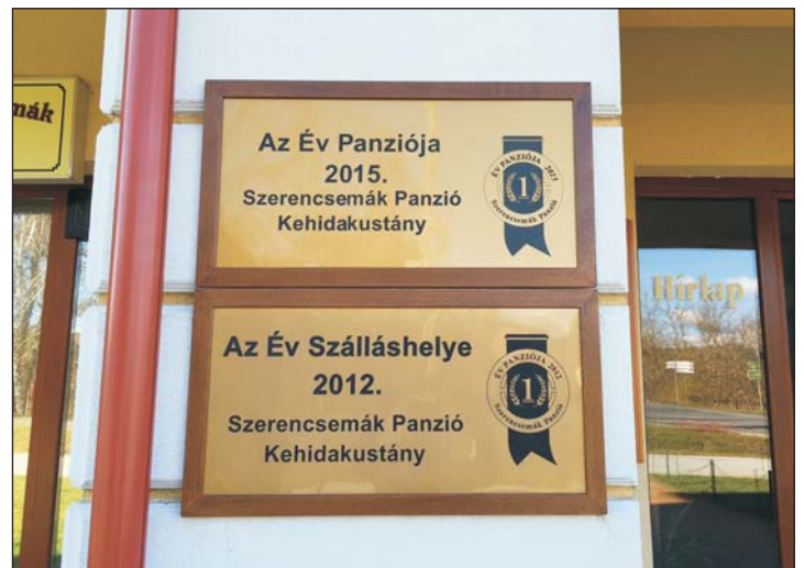
Az elismerést jelző táblák.