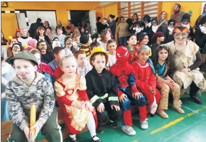
Ötletes jelmezekben nem volt hiány.

A zalacsányi Csány László Általános Iskola február 5-én, pénteken tartotta hagyományos farsangját. A délután nagyon jó hangulatban telt, ahol minden osztály kített magáért. Két osztályban egyéni jelmezeket a többi hatban pedig cso-