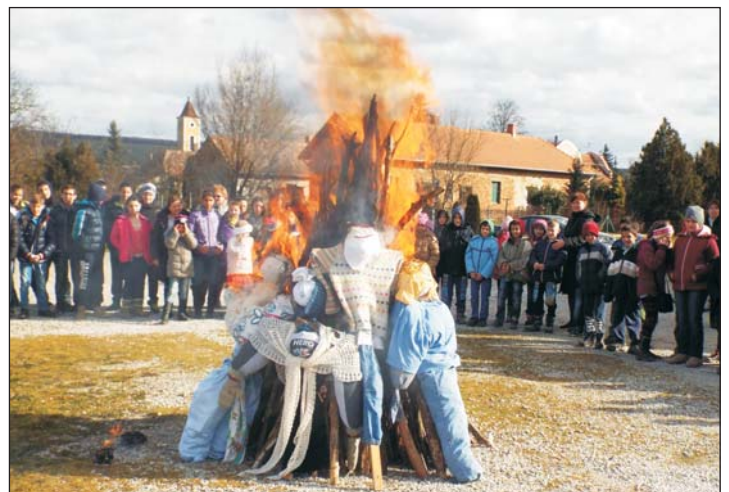
Minden csoport elégette a saját kiszebábóját.