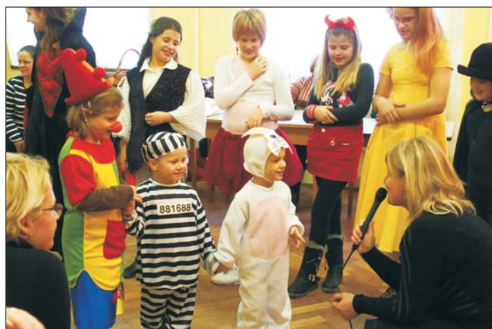
Sokan öltöztek jelmezbe az idei farsangon is.