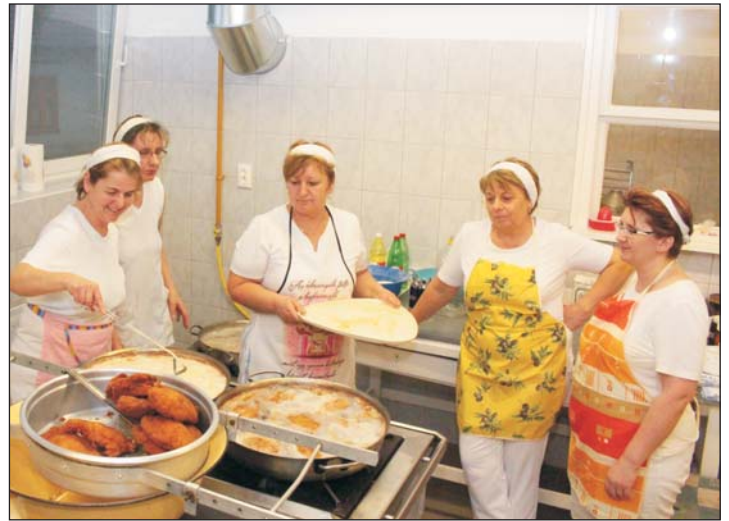
A dolgozók januárban már az új eszközökkel kezdhették el a munkát.

- Megújult az elszívó berendezés, megszépül a terasz, új gázsámolyt, króm főzőedényeket is kaptunk. Összesen heten dolgozunk a konyhán, a