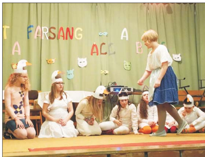
Nagy tapsot kapott a gyerekek báli műsora.

és a lakosságtól, így a program idén is gördülékenyen valósult meg. A támogatásokat, felajánlásokat, aktív részvételt ezúton is tisztelettel megköszönjük. A bál bevételéből egy jelentős rész a település építését segíti, a többi bevétel pedig a nagyobb közösségi programok, így a július 16-ai Pogácsa és Fröccs Fesztivál és a július végi