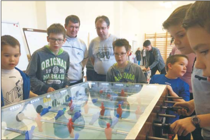
A gyerekek körében is népszerű a csocsó.

Második alkalommal került megrendezésre a TDM amatőr csocsó és asztalitenisz gála a Kehidakustányi Turisztikai Egyesület szervezésében és a Malomkő Étterem támogatásával.