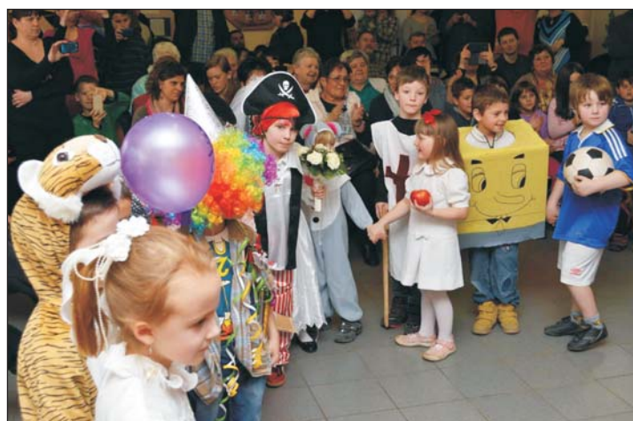
A jelmezes felvonulás.

Pedagógiai programunkban kiemelt helyet kap a néphagyományörzés és az óvoda hagyományai. Ennek keretén belül került sor 2016. január 30-án az óvodai farsang megszervezésre. A gyerekekkel már egész héten készültünk az ünnepre. Beszélgettünk velük a farsangi hagyományokról, népszokásokról, a farsangi multságok hangulatáról és a farsangi álarcok szerepéről.