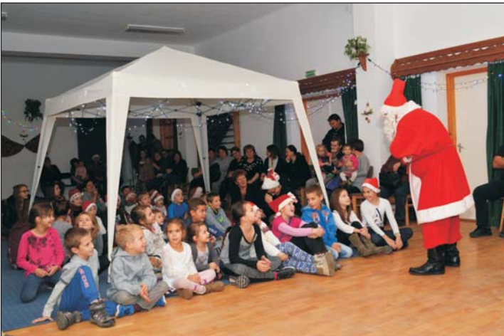
Izgatottan várta a gyereksereg a Mikulást.