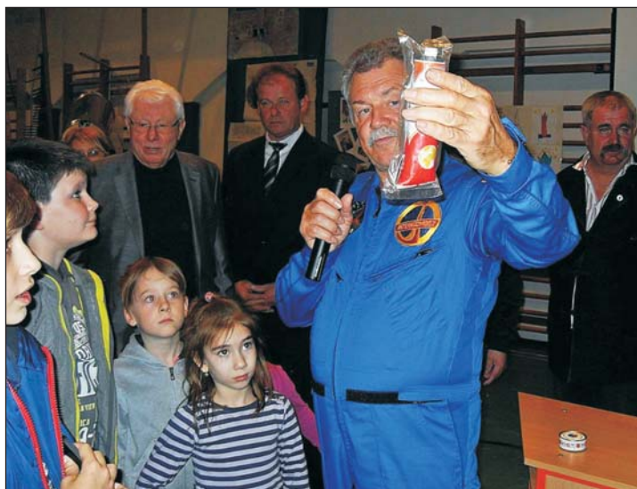
Farkas Bertalan mutatja, hogy milyen konzervekből ettek.

A türjei önkormányzat és a Szent László Általános Iskola meghívására a községbe látogatott az első (és eddig egyetlen) magyar űrhajós, Farkas Bertalan . Az érdeklődő gyerekekkel és tanáraikkal, felnőttekkel teli tornaterem egyik falán a tanulók által készített tablók a technika és az űrhajózás fejlődését mutatták be. Egy tablón a híres vendégről gyűjtött írások és képek voltak. Az előadói asztal felett pedig egy „igazi” űrhajó lógott, amit Boros Csaba és Ágh János készített. Nagy Ferenc polgármester köszöntőjében elmondta, hogy milyen megtiszteltetés ez a találkozás Farkas Bertalannal. Ismertette kitüntetéseit, betöltött tisztségeit, majd átadta a szót a vendégnek.