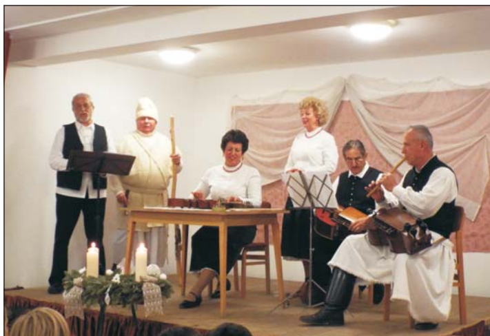
A gyenesdiási fellépők népi hangszerekkel színesítették műsorukat.

sárolhattak karácsonyi puzsedit, peracet és mézeskalácsot. Az előtérben megvendégelték a résztvevőket teával, forralt borral és különböző süteményekkel, melyeket szívesen fo-