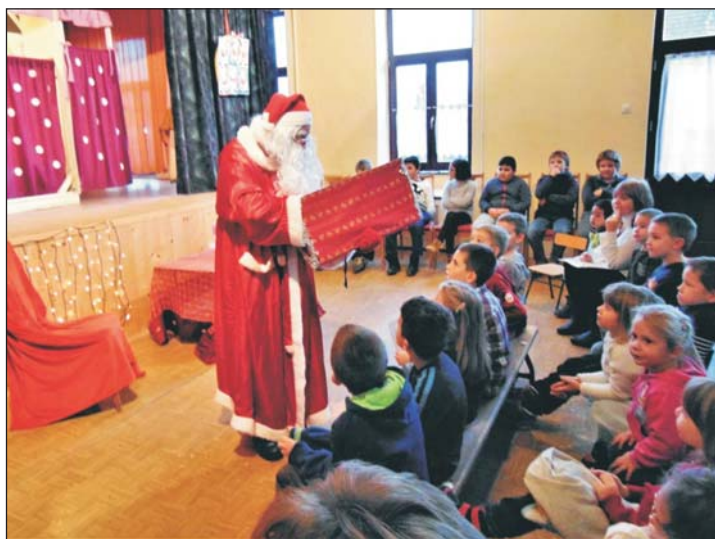
Közel ötven gyermeknek hozott ajándékot a Mikulás.

Kedves élményben volt része minden megjelent vendégnek december 6-án délután Batykon . E nevezetes napon a Mikulás ellátogatott hozzánk is. Közel 50 gyermek gyülekezett a művelődési házban, izgatottan foglaltak helyet kísérőikkel együtt.