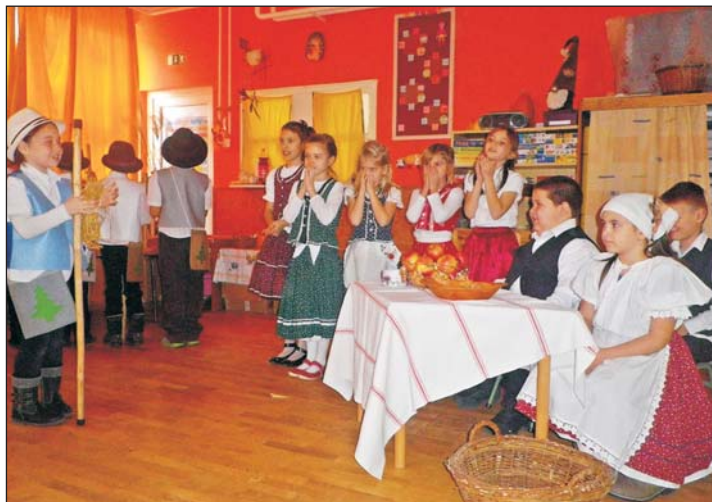
Az iskolások több helyen is bemutatták a lucázást.