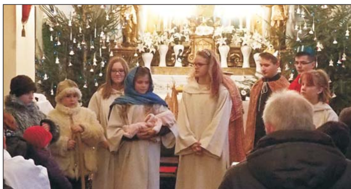
Az ünnepvárást a tekenyei gyerekek pásztorjátéka koronázta meg.