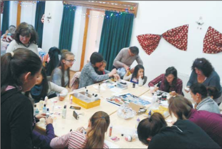
Az adventi forgatag ebben az évben is sikeres volt.