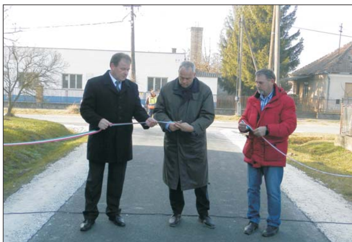
Az ünnepélyes átadás pillanata.