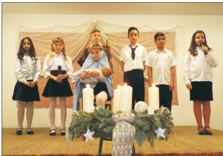
Az iskolások előadása mindenkit magával ragadott.

A vendégek Csiszár Tibornétól az idei évben is vá-