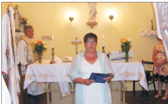
A levelet a polgármester olvasta fel.