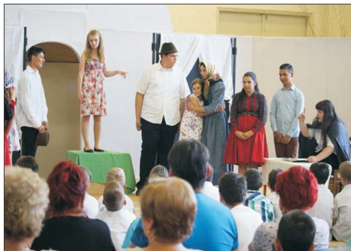
A diákok színjátszásban is megmutatták tehetségüket.

– Több évtizede megrendezzük a művészeti bemutatónkot, valamint az érdeklődők a szokásos kiállításunk mellett a „pincegalériánkban” az alapfokú művészeti iskolá-