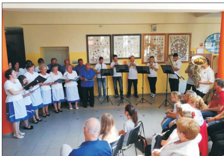
Tartalmas műsort láthattak a vendégek.