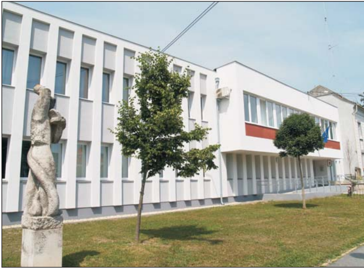
A felújított járási hivatal.