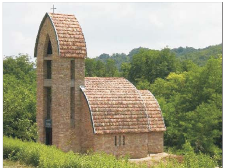
A gyönyörű környezetben fekvő Szent László kápolna.